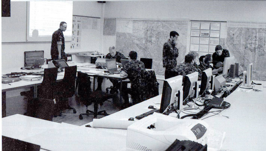
Cellule de renseignement (DBEM 2) de la brigade blindée 1, lors de l'exercice LÜTHY en 2007.