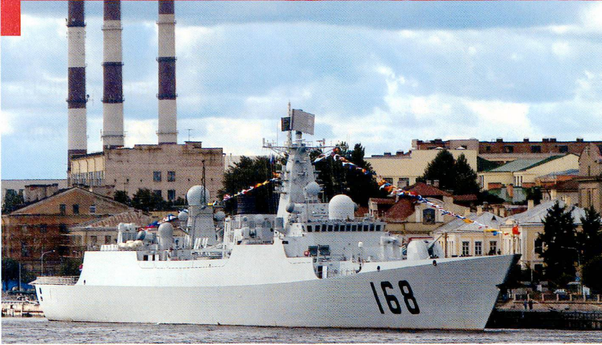
Le destroyer chinois Guangzhou et un autre bâtiment à St Petersburg, le 27 août 2007. Les deux navires ont également fait escale en Grande Bretagne, en Espagne et en France. La marine chinoise est en pleine croissance, répondant au besoin de sécurité des lignes maritimes.