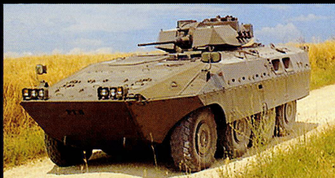
Le châssis 8x8 du Centauro est également la base d'une famille de véhicules de transport d'infanterie et d'exploration à roues.