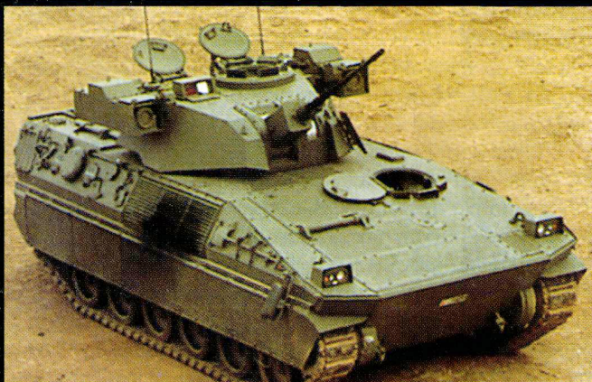
Le Dardo est le véhicule de combat d'infanterie standard.