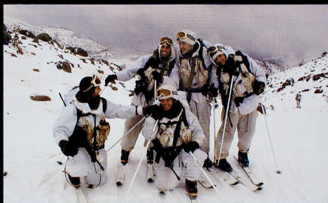
L'infanterie légère italienne (montagne, marine) est engagée dans de nombreuses missions de maintien de la paix à travers le monde.