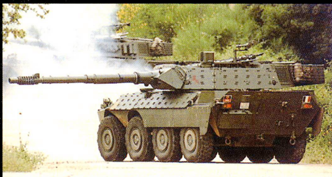
L'armée italienne, au sein de l'OTAN, dispose de réelle compétence dans la mise à disposition de forces légères, à l'instar du char léger à roues Centauro équipé d'une tourelle de 10,5 cm.