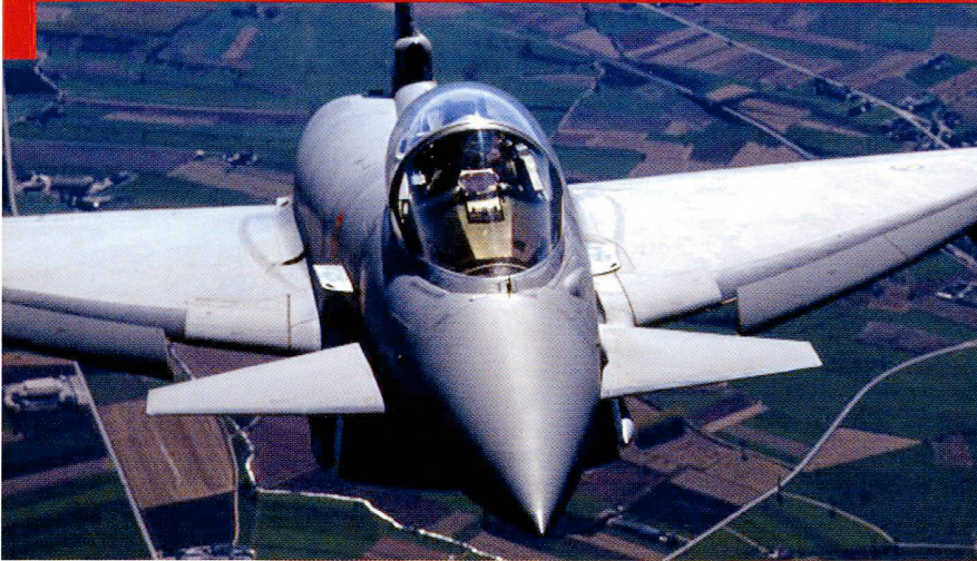
L'introduction de l'Eurofighter dans les Forces aériennes italiennes (AMI) se fait de manière laborieuse et coûteuse.