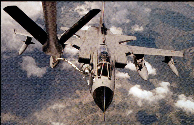
La flotte de Tornado est la colonne vertébrale de l'AMI. Ces appareils ont connu plusieurs engagements dans le Golfe et les Balkans.