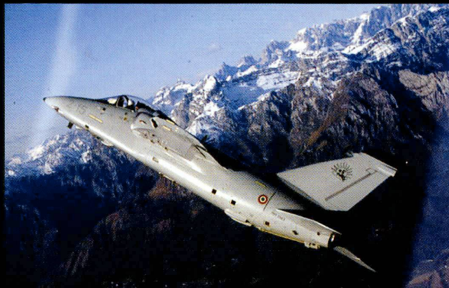
L'AMX est un appareil léger d'entraînement et d'appui au sol.