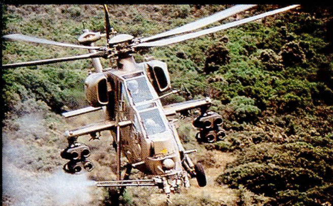
L'Agusta 129 Mangusta est un hélicoptère de combat polyvalent et redoutable.