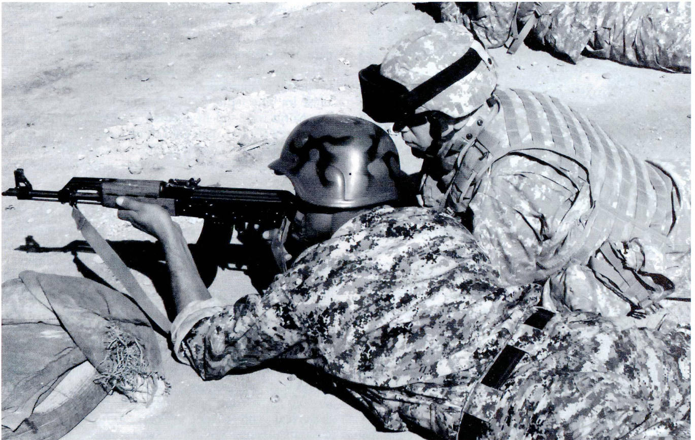
Instruction au tir et encadrement de soldats de l'armée nationale afghane (ANA) par des moniteurs américains.

und militärischen Operationen. Da die Sicherheits-Agenten selbst die professionelleren Experten in Sachen Sicherheit sind, ist ihr eigener Ratschlag vital für eine gelungene Sicherheitspolitik. Gleichzeitig benötigt eine Administration in demokratischen Staaten eine hinreichende Anzahl zusätzlicher, ziviler (Sicherheits-)Experten, die in Verteidigungsministerien und dem Parlament eine wichtige Scharnierfunktion innerhalb der ZMB wahrnehmen. Nicht zuletzt sollte stets eine breitere Öffentlichkeit von unabhängigen Journalisten und zivilgesellschaftliche Institutionen gefördert werden, die sich regelmässig und informiert mit Sicherheits- und Verteidigungspolitik auseinandersetzen. Denn in einer demokratischen Gesellschaft darf die Formierung einer ‚Sicherheits- und Verteidigungsgemeinschaft‘ nicht einem exklusiven Club von Agenten und informellen Kreisen vorbehalten sein. Sie muss notwendigerweise, wenn auch differenziert, eine breitere, über die Staatlichen Gewalten hinausreichende Experten-Gemeinschaft miteinbeziehen. Sektoren-übergreifenden öffentliche Debatten, die über die Parlamente hinausreichen, sind ein wichtiger Bestandteil gerade auch im Prozess der Formulierung von Sicherheitspolitik.