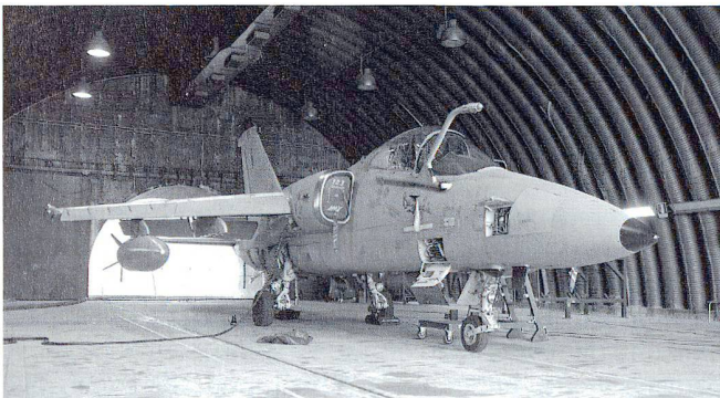
Les Forces aériennes comptent 53 AMX : un avion léger d'entraînement avancé et d'attaque italo-brésilien développé par Aermacchi et Embraer. Sa défense aérienne repose sur 12 Mirage 2000 et 57 F-5E Tiger .