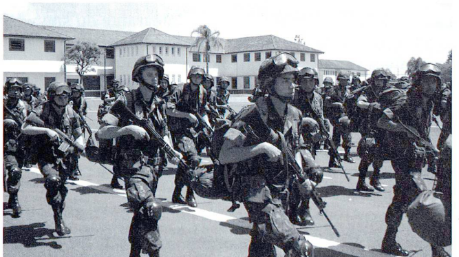
Compagnie de commandos-parachutistes brésiliens, équipés du M964 FAP – une version produite localement du FN FAL.