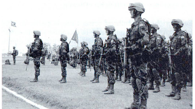
Le statut de grande puissance s'acquiert également par l'envoi de contingents au profit de l'ONU, notamment à Suez, au Timor oriental ou depuis 2004 à Haïti.