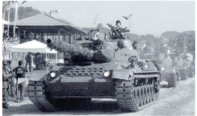
Les forces mécanisées brésiliennes sont équipées de 398 chars Léopard 1 et 584 M113 ACAV.