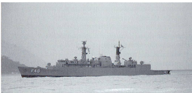
Le F46 Greenhalgh (ex F88 HMS Broadsword , vétéran de la guerre des Malouines) a retrouvé le Pacifique sud sous l'étendard brésilien.

objectif de relier les régions entre elles et de servir de vecteur économique. Mais l'entretien de cette voie tient du miracle dans la mesure où les forêts recouvrent sans cesse l'asphalte. Ceci explique pourquoi les deux-tiers de la région amazonienne sont impropres à la concentration humaine à cause de l'humidité, des maladies engendrées et d'une végétation inaccessible.