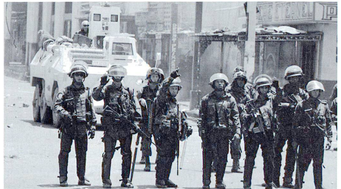
Une section d'infanterie brésilienne à Haïti. Le Brésil compte 369'742 militaires et 1'115'000 réservistes ; le service militaire obligatoire a lieu entre 19 et 45 ans.