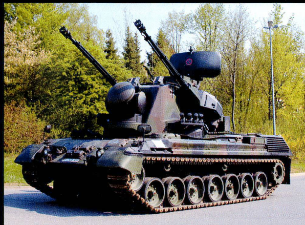
Le Gepard sert à la protection aérienne des bataillons blindés.