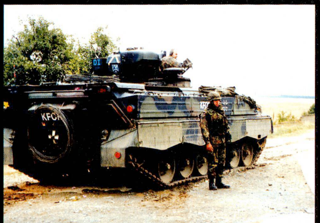
Le VCI Marder au Kosovo.