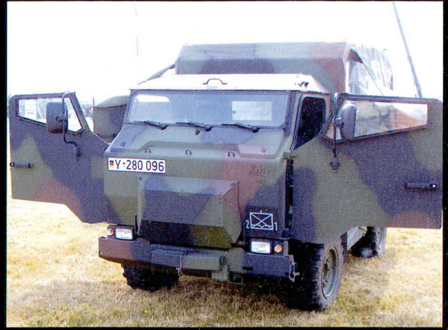
Le transport de troupes légèrement blindé Mungo .