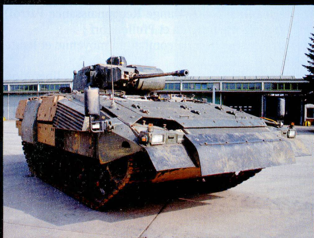
Le projet Puma vise à remplacer le VCI Marder .