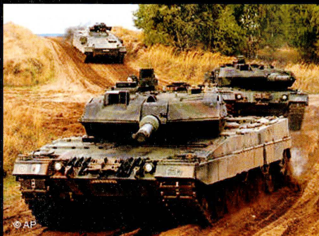
Une centaine de Leopard 2 A5/A6 équipent désormais les bataillons de chars de la Bundeswehr.