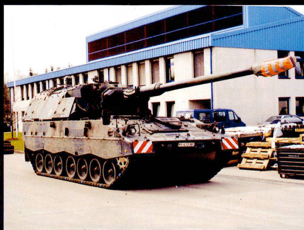
Le Panzerhaubitze 2000 sert à l'appui de feu des bataillons lourds.