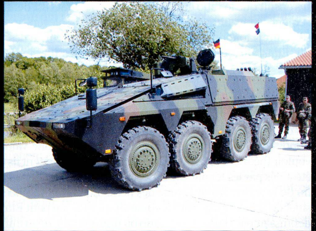
Le VTT Boxer européen.