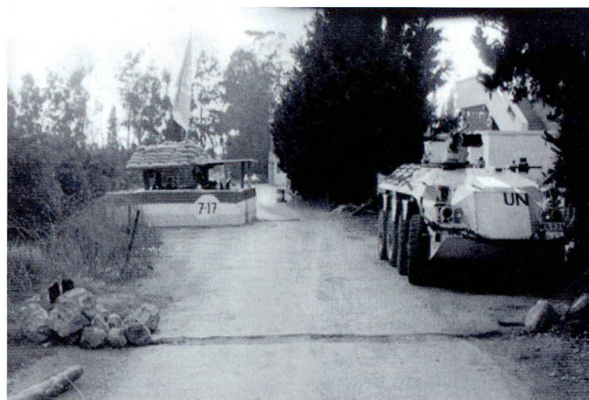
Un poste d'observation de la compagnie Charlie du DUTCHBAT 2.

A 4h34 le matin du 6 juillet, des obus d'artillerie s'abattent sur les po obs Foxtrot et Delta, au sud-est et au nord de l'enclave, ainsi qu'à proximité du QG de Potocari. Foxtrot est détruit par deux coups au but, tirés par un char serbe à 12h55. Au même moment, le Dutchbat annonce au commandement de la FORPRONU qu'il est directement attaqué ; ordre est donné de se rendre aux abris. Entre 13 et 14h, le Lt col Karremans fait une demande d'appui aérien, qui est refusée par l'état-major des Forces –le commandant étant absent– sur le motif que les frappes ne doivent être utilisées qu'en « dernier recours. » Plusieurs