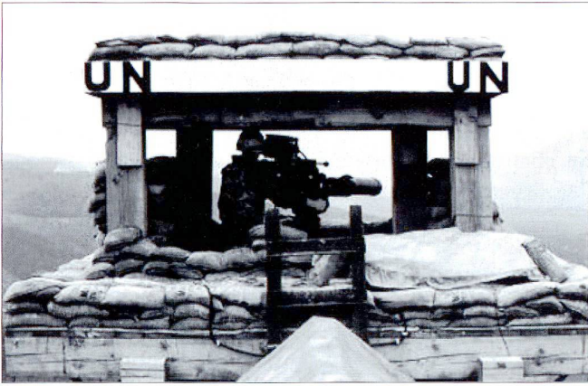
Un poste d'observation néerlandais armé d'un engin filoguidé antichar (efa) TOW.

A 11h59, un char serbe s'avance à moins de 100 mètres de Foxtrot et fait feu sur les combattants bosniaques qui se sont repliés 200 mètres derrière le po obs de l'ONU. Le lance-missile TOW néerlandais, endommagé par les tirs, est inutilisable ; il reste bien aux casques bleus une roquette AT-4, mais le commandant de la compagnie Bravo –avec l'accord de son supérieur- ordonne de ne pas tirer, pour permettre à ses soldats de se replier. Le po obs est submergé à 14h26 et les Serbes exigent des casques bleus qu'ils remettent leurs armes et abandonnent leur position. Montant dans leur VTT, les Néerlandais sont stoppés par les combattants bosniaques, qui demandent que ceux-ci restent les défendre. Lorsque ceux-ci refusent, un soldat bosniaque lance une grenade qui tue un des soldats de la paix.