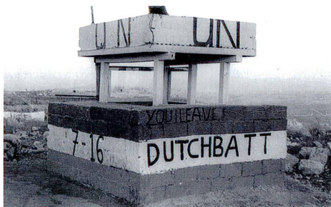
Un des postes d'observation du DUTCHBAT à Srebrenica.

d'armes lourdes sur les positions de barrage ou sur les postes d'observation du Dutchbat.