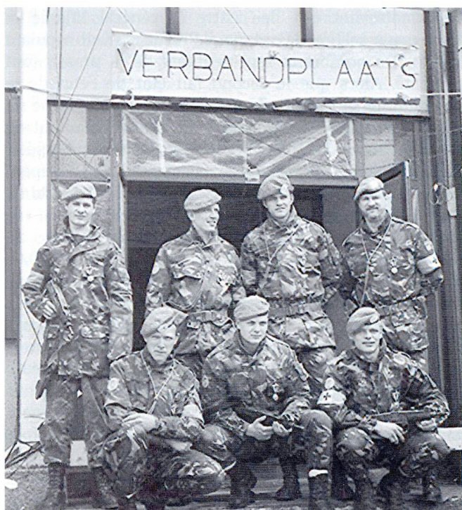
Un groupe de casques bleus néerlandais du DUTCHBAT3.

d'hommes sont rassemblés par les soldats serbes dans un hangar ; au moins 50 sont fusillés. Dans le convoi pour Kladanj, les hommes sont sortis pour terminer le chemin à pied. Plusieurs personnes, dont trois femmes travaillant pour MSF, disparaissent. De nombreuses exécutions sommaires ont lieu pendant la nuit autour de Potocari. Quant à la colonne de 15'000 hommes fuyant vers Tuzla, dont un tiers porte des armes, les forces serbes tirent dessus à l'arme lourde et tendent plusieurs embuscades tout au long des 60 km qui les séparent de la Fédération. 19