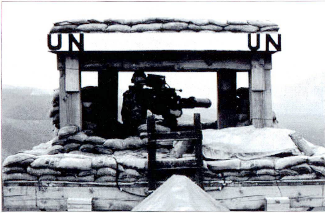
Un poste d'observation néerlandais armé d'un engin filoguidé antichar (efa) TOW.

A 11h59, un char serbe s'avance à moins de 100 mètres de Foxtrot et fait feu sur les combattants bosniaques qui se sont repliés 200 mètres derrière le po obs de l'ONU. Le lance-missile TOW néerlandais, endommagé par les tirs, est inutilisable ; il reste bien aux casques bleus une roquette AT-4, mais le commandant de la compagnie Bravo –avec l'accord de son supérieur- ordonne de ne pas tirer, pour permettre à ses soldats de se replier. Le po obs est submergé à 14h26 et les Serbes exigent des casques bleus qu'ils remettent leurs armes et abandonnent leur position. Montant dans leur VTT, les Néerlandais sont stoppés par les combattants bosniaques, qui demandent que ceux-ci restent les défendre. Lorsque ceux-ci refusent, un soldat bosniaque lance une grenade qui tue un des soldats de la paix.