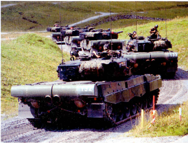
Exercices de tir de section sur la place de tir de Wichlen.

Après un contact avec l'adversaire, ceux-ci s'éclipsent sous couvert de nébulogènes, annonçant avec autant de précision que possible la force, l'emplacement et les intentions de ROUGE.