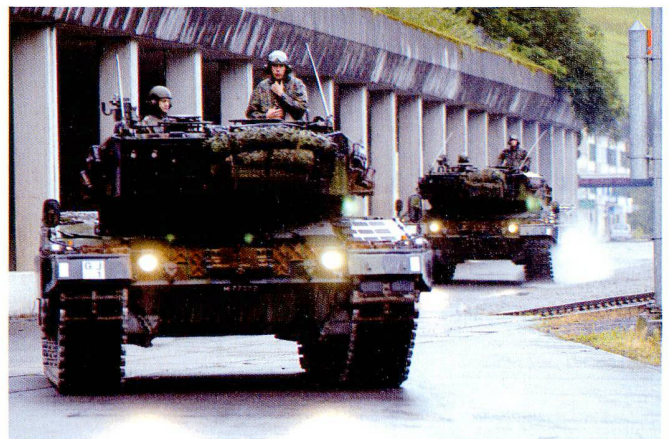
ZELZELE UNO ET DUE : déplacement de la 17/1 entre Schwanden et Wichlen.