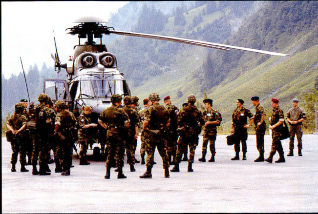
Accueil du Team d'inspecteurs OSCE, arrivés à Wichlen en Cougar .