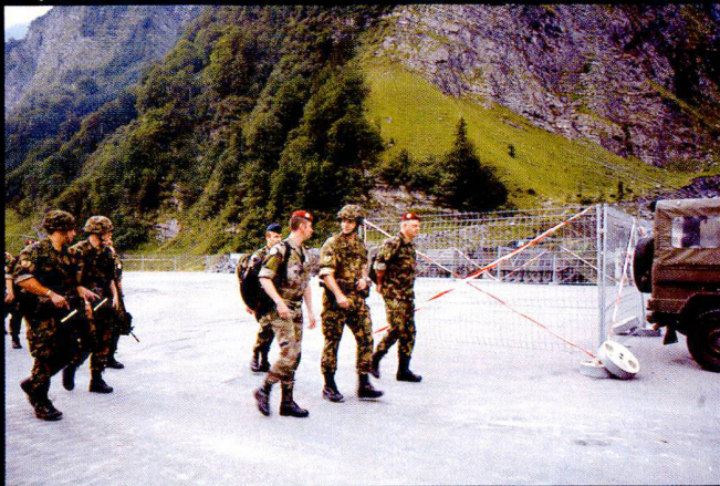
Déplacement vers les places d'exercice, sous bonne escorte