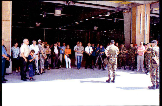
Une démonstration de tir a été organisée le 25.08 pour les partenaires et anciens du bat chars 17.

Alors qu'un « team » (17/1 et 17/4) s'entraînait à Wichlen, un second « team » composé des compagnies de chars 17/2 et 17/3 était engagé sur la place de tir de Hinterrhein. Les résultats des tirs ont été centralisés dans l'EAVC.