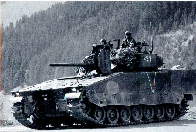
Le CV-90 offre un bon compromis entre la puissance de feu, la mobilité et la protection.