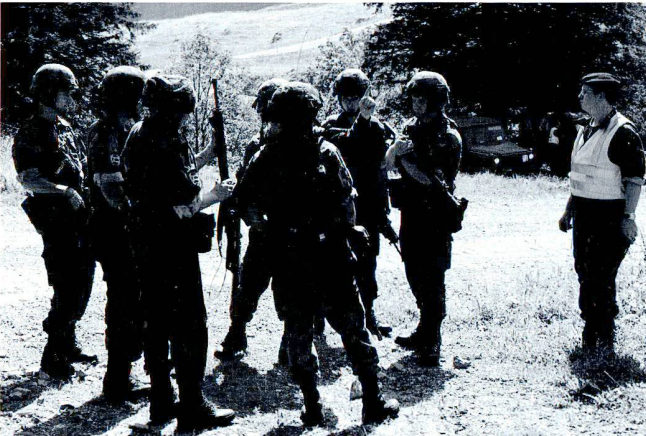
Rien ne sert de courir.... Un groupe gren chars débarqué prépare son engagement.

A tout moment, la compagnie d'avant-garde doit se tenir prête à se laisser dépasser par les formations de combat principales du bataillon. Il est donc important, même pendant la marche, de régler les comportements ou d'appliquer les standards pour tenir un ou plusieurs axes ouverts. Les débouchés ou la sortie des passages obligés ou des franchissements sont, sauf ordre contraire, de la responsabilité de la formation qui les tient ouverts. De la même manière, à tout moment la compagnie doit se tenir prête à mener un combat de rencontre et/ou à passer rapidement à la défense, afin par exemple de barrer ou de contenir une contre-attaque de l'adversaire, vers l'avant