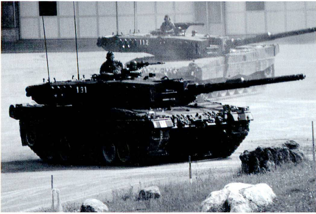
La compagnie d'avant-garde reçoit des appuis -une section de chars de combat- avec lesquels elle doit apprendre à collaborer étroitement.