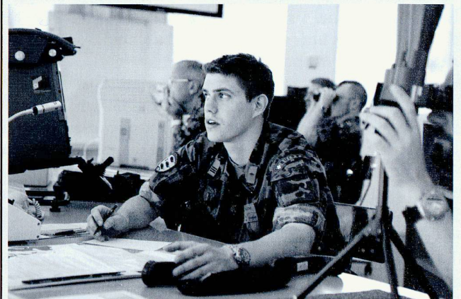
Inspection de la cp gren chars 17/4 par le commandant de brigade.

ou sur les flancs. Elle crée ainsi les conditions favorables pour la poursuite de l'action au niveau du bataillon. Une fois l'action menée à bien, la compagnie se réorganise afin de se tenir prête à des actions ultérieures.