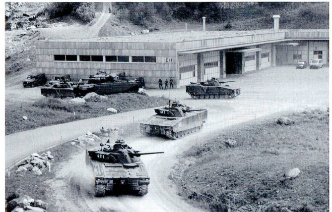
Exercice de section sur la place de Wichlen.

à partir de positions préparées, il s'agit de le fixer sur place, en l'empêchant de rejoindre ses forces principales et en le privant de l'appui de celles-ci ; cela se fait généralement par le feu – au besoin avec un appui immédiat par le feu des lance-mines ou de l'artillerie-, à la plus grande distance de combat possible (1'500 à 3'500 mètres).