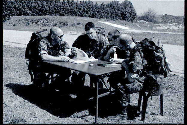
A côté des épreuves physiques, le programme comprenait aussi des tests exigeants