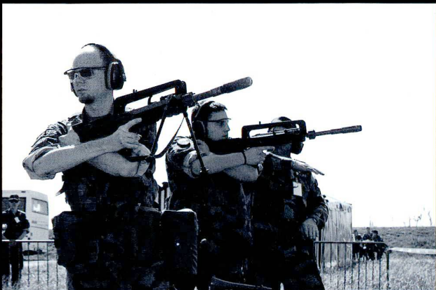
Concentration avant le départ du coup d'un lance-grenades