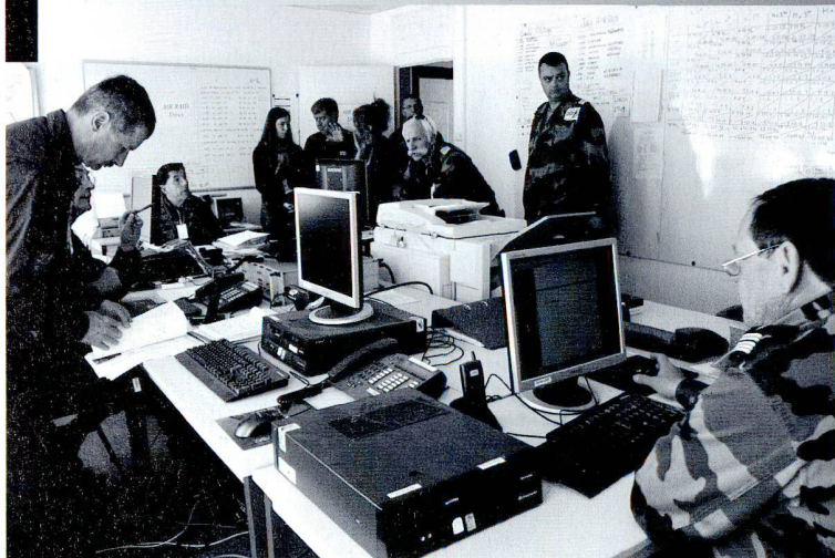
Le poste central de coordination de AIR RAID.