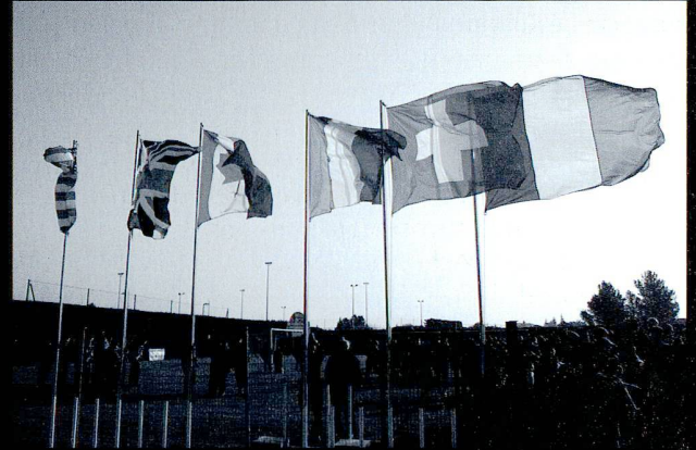
Fierté de voir notre drapeau dans le ciel lors de la cérémonie finale