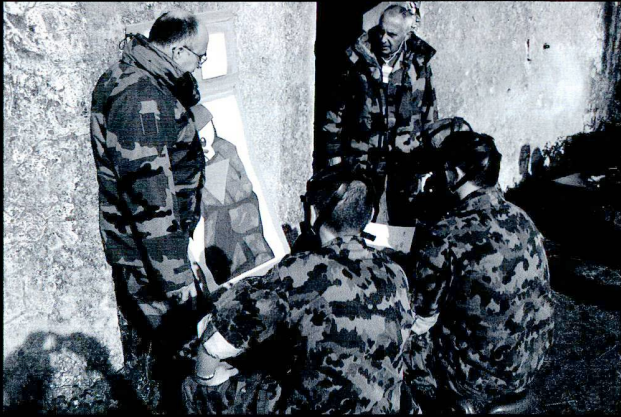
Donnée d'ordres pour les tirs en conditions C.