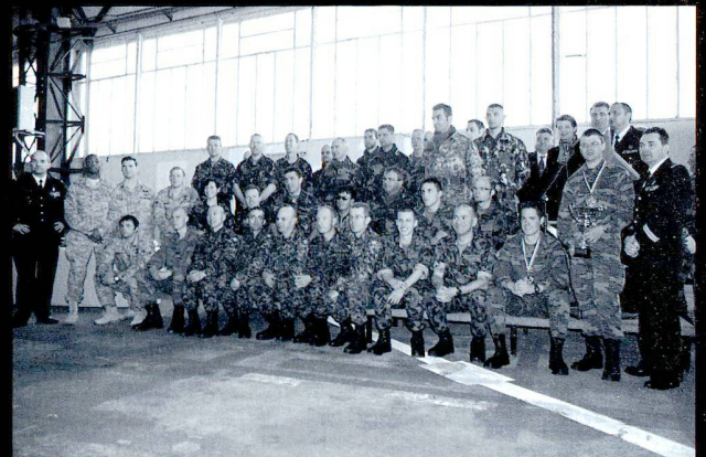
Participation internationale, à côté de l'USAF, RAF et des Belges, on trouve des équipes d'Italie et du Canada