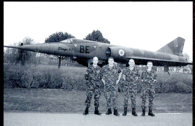
La délégation suisse devant un Mirage IV sur la Base Aérienne d'Orange