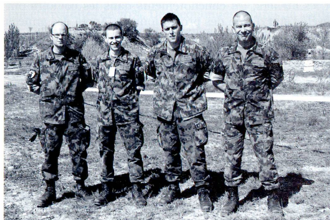
Préparation et départ de la patrouille helvétique.