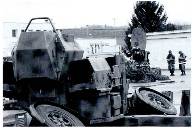
La défense sol-air nécessite une combinaison de canons, de missiles et de radars.

En réseau et en combinaison avec les aéronefs, afin de constituer une véritable architecture de Défense Sol-Air! Il est trop tôt pour parler d'un armement précis, mais notre rapport décrira des capacités devant répondre à des menaces d'un spectre large ; on peut déjà en déduire que les systèmes DSA du futur seront certainement évolutifs. Et pour le reste, il faut attendre les réponses de l'EM de l'Armée.