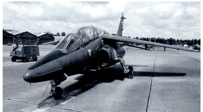
Alphajet : avion école de la chasse française sur la base de Tours.

Les buts principaux de notre section sont de promouvoir les contacts entre officiers ayant servi dans les Forces aériennes, de perpétuer la camaraderie et de participer au perfectionnement des connaissances militaires et aéronautiques de ses adhérents.