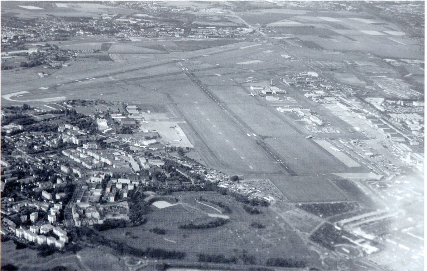
Le Salon de l'aéronautique et de l'espace vu du ciel.

rassemble autour de lui non seulement les anciens mais aussi des gens d'aujourd'hui, c'est-à-dire des jeunes qui rentrent en formation et qui ont besoin de s'inspirer de