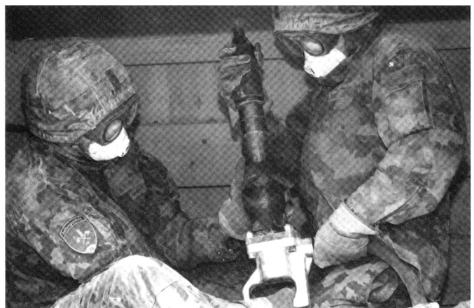
Troupes de sauvetage travaillant dans les décombres.