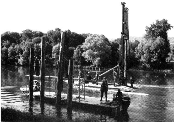
Mise en place de sonnettes pour le PPA.