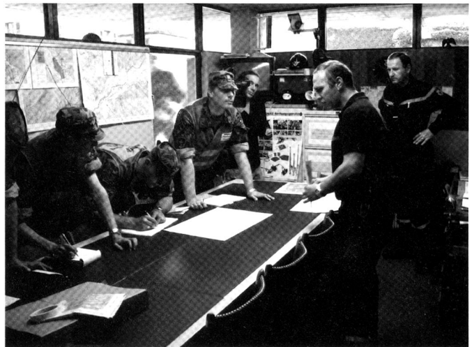
Cadres des troupes de sauvetage durant un rapport de coordination.