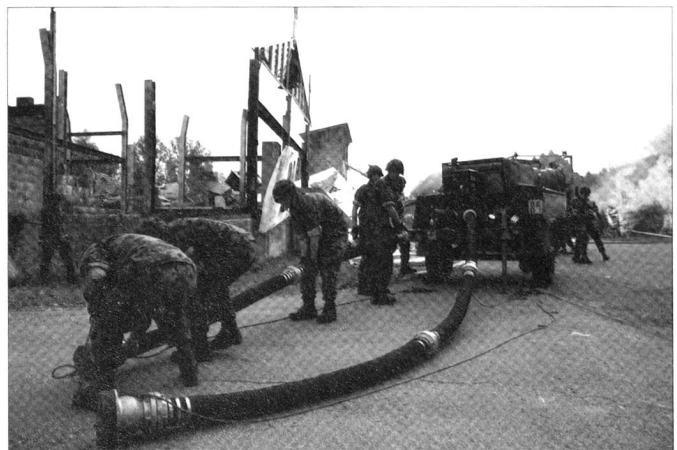
Les troupes de sauvetage peuvent également être engagées dans les cas d'incendies importants.