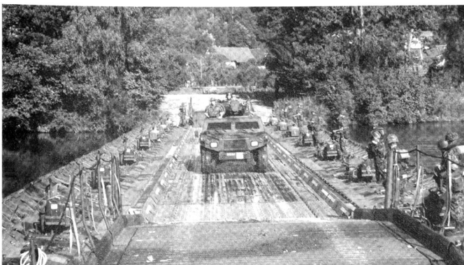
Pont flottant à Widegg.