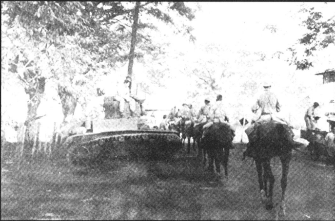
Unité de la 26 th Cavalry, partiellement montée et partiellement mécanisée.