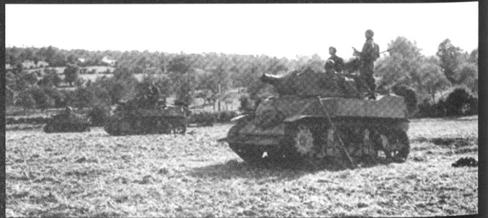
75 mm Gun Motor Carriage M8, sur châssis du M3. Celui-ci appartient au 113 th Cavalry Regiment à Heure le Renan, 9 septembre 1944.