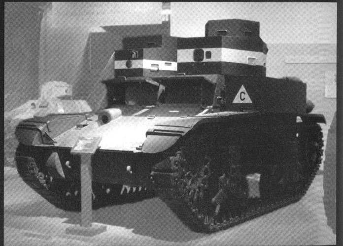
Un Combat Car, rebaptisé M2 à la fin des années 1930. Celui-ci est exposé au musée de Fort Knox.