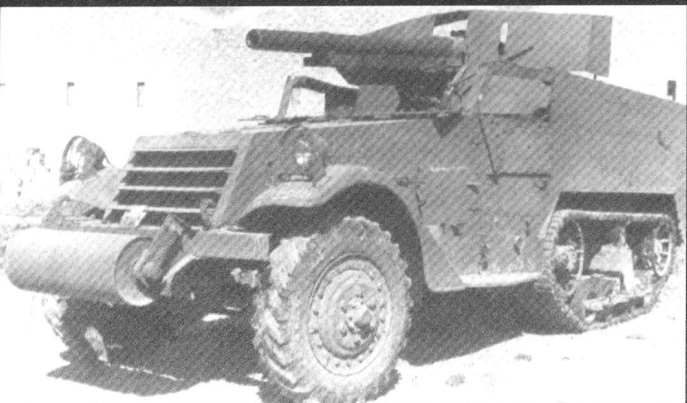
Chasseur de chars M3 armé d'un canon de 75 mm.