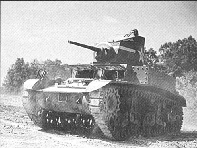
Char léger M3 armé d'un canon de 37 mm à Fort Knox, en 1941.