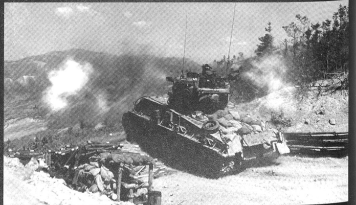
Un M4A3E8 Sherman sur une position surélevée en Corée. Une fois disparue la menace des T34/85, les chars ont servi essentiellement d'artillerie mobile.