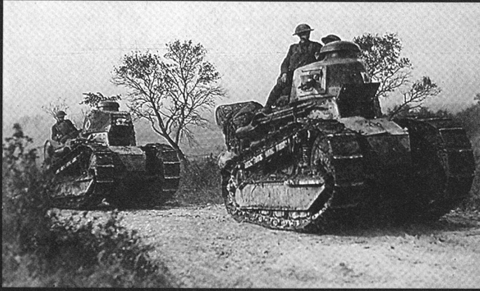
Deux chars Renault FT-17 construits aux USA (on les reconnaît à leur tourelle ronde) sur le front de l'Argonne en 1918.