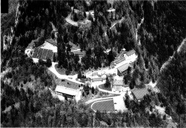
Ci-contre: la place d'armes de Dailly, au-dessus de St Maurice VS. En bas: le système BISON est aujourd'hui le seul armement en service capable de frapper des buts distants de plus de 30 km.