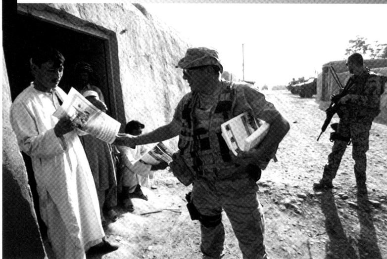
Diffusion d'informations en Irak, par des équipes de relations civiles-militaires (CIMIC).