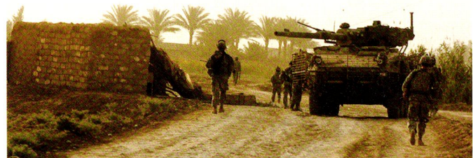
Les débuts opérationnels du MGS ont été en 2007, au sein de la 4 th SBCT, 2 nd ID.