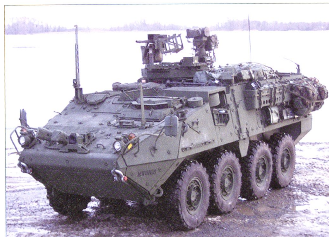
Le M1131 FSV est la version commandant de tir du Stryker .