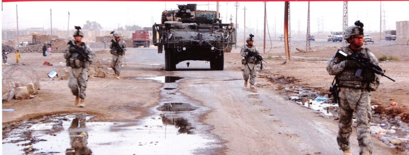
Progression d'une section de la 3 rd SBCT en Irak.

A la fin de 2005, avec 300 engins déployés en Irak depuis près de deux ans, des études ont déterminé la nécessité de remplacer ceux-ci par de nouveaux véhicules. Ces Stryker ont servi un an à la formation de nouvelles unités, puis ont été entièrement remis à neuf. Depuis 2006, une infrastructure de maintenance a été installée par General Dynamics Land Systems (GDLS) au Qatar. Chaque année, une centaine de véhicules y sont totalement démontés et remis à neuf, pour un coût annuel de 127 millions de dollars.