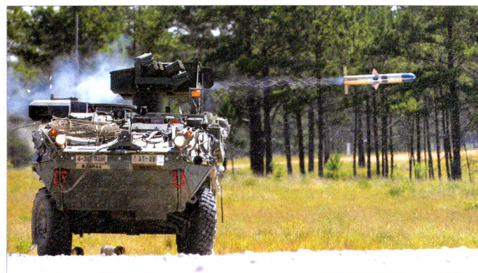
Le M1134 et sa tourelle TOW permettent une défense minimale contre des forces conventionnelles.

La base du concept de SBCT est la capacité de déployer une brigade par avion n'importe où dans le monde dans les 96 heures, une division en 120 heures et cinq divisions en 30 jours, tout en pouvant débuter les opérations dès l'arrivée. 2 Une brigade représente le déplacement de 7'800 tonnes et nécessite 288 chargements par C-17 Globemaster III . La brigade dispose d'une empreinte logistique réduite et peut donc se satisfaire d'une infrastructure austère. La brigade est capable d'agir dans tout le spectre des conflits (guerre, contingence, paix) et des opérations militaires : offensive, défensive, stabilisation et appui. Pour cela, une SBCT dispose des capacités opérationnelles suivantes : 3