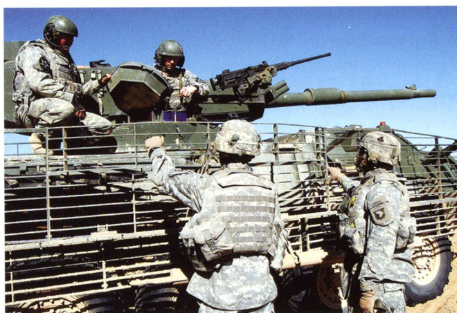
M1128 MGS du 2 SCR en Afghanistan, été 2009.