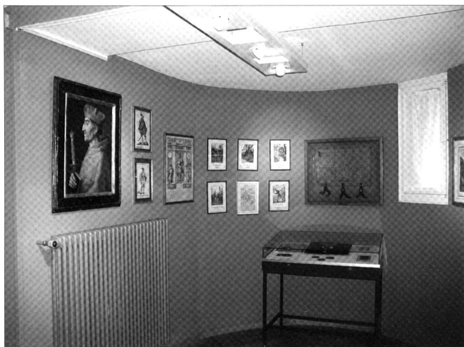
Salle consacrée au régiment de Diesbach.

la présence fort discrète d'un Etat bien contrôlé par un souverain « insaisissable » - le peuple -, hors d'atteinte d'un fisc insatiable ou d'un pouvoir étranger, offrait les meilleures garanties à un investisseur de « revoir ses sous ». Des hommes illustres et influents, tels que le Genevois Jacques Necker, ministre des finances de Louis XVI ou Albert Gallatin, premier secrétaire aux finances des Etats-Unis révolutionnaires, s'appuyaient évidemment sur cette « stabilité suisse ».