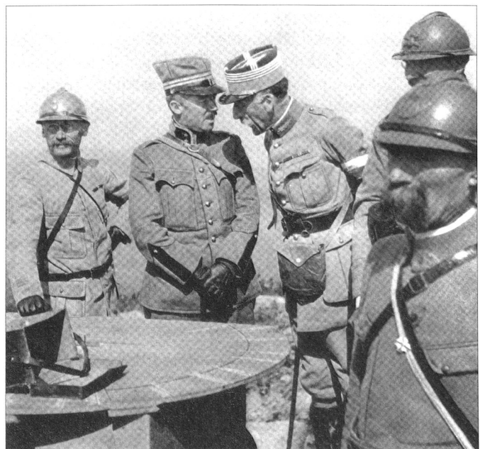
Visite de Guisan sur le front de Verdun en 1916.