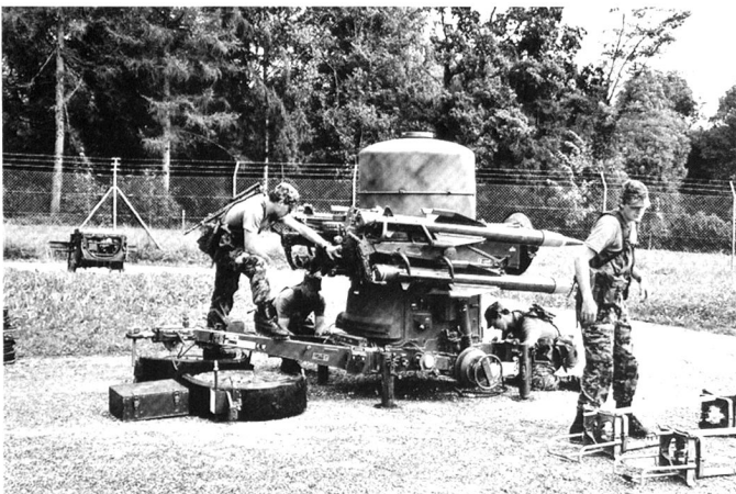
La réduction de la défense aérienne soulève la question fondamentale de la capacité aux engagements de défense «conventionnelle».

«Un équilibre durable entre les prestations et les ressources ne peut pas être garanti dans les conditions-cadres actuelles. (...) Le seul moyen d'atteindre à l'équilibre (...) est d'augmenter [à 5 milliards] les moyens financiers consacrés à l'armée et d'adapter son organisation (...) ou de réduire massivement les prestations exigées.»