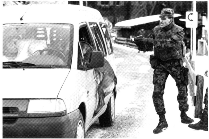
Les engagements «subsidiaries» deviendront-ils les engagements... «prioritaires»?

Pour le Conseil fédéral, la collaboration internationale comprend l'instruction, l'acquisition d'armements et d'équipements, dont la plus grande partie n'est pas produite en Suisse, l'aide humanitaire et la promotion de la paix pour laquelle 1000 militaires et un budget annuel de 100 millions de francs sont prévus. Le Rapport ne fait qu'effleurer le niveau d'autonomie de la défense qu'il propose et la coopération nécessaire avec l'étranger. Ce silence, sans doute motivé par le respect de la neutralité et par la crainte de créer des échauffements politiques, n'en apparaît pas moins comme une lacune. L'armée «garantit de la façon la plus autonome possible le maintien et le développement de la compétence essentielle de la défense. Elle fournit les autres prestations en collaboration avec des partenaires nationaux et internationaux.» Vu les coûts, «la question se pose de savoir si la Suisse peut continuer à assurer seule la sauvegarde de sa souveraineté sur l'espace aérien ou s'il faut chercher une solution commune avec des Etats voisins». Cette voie semble peu prometteuse car, neutralité oblige, elle ne concernerait