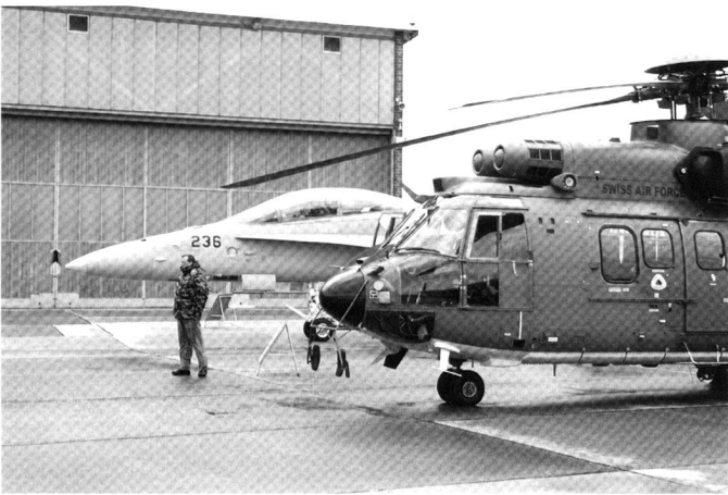
Les moyens de défense aérienne et de transport suffisent-ils? Et sont-ils cohérents?