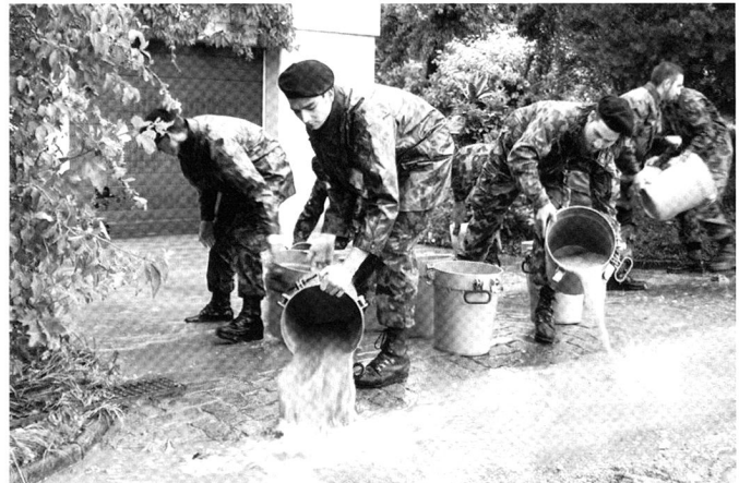
Certaines troupes - à l'instar du Génie - sont plus aptes que d'autres à être engagées dans le domaine de l'appui aux autorités lors de catastrophes naturelles.