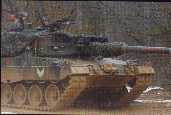
Les chenilles avalent la boue, la neige, ; il faut simplement ajouter des crampons pour la glace... et éviter les routes !