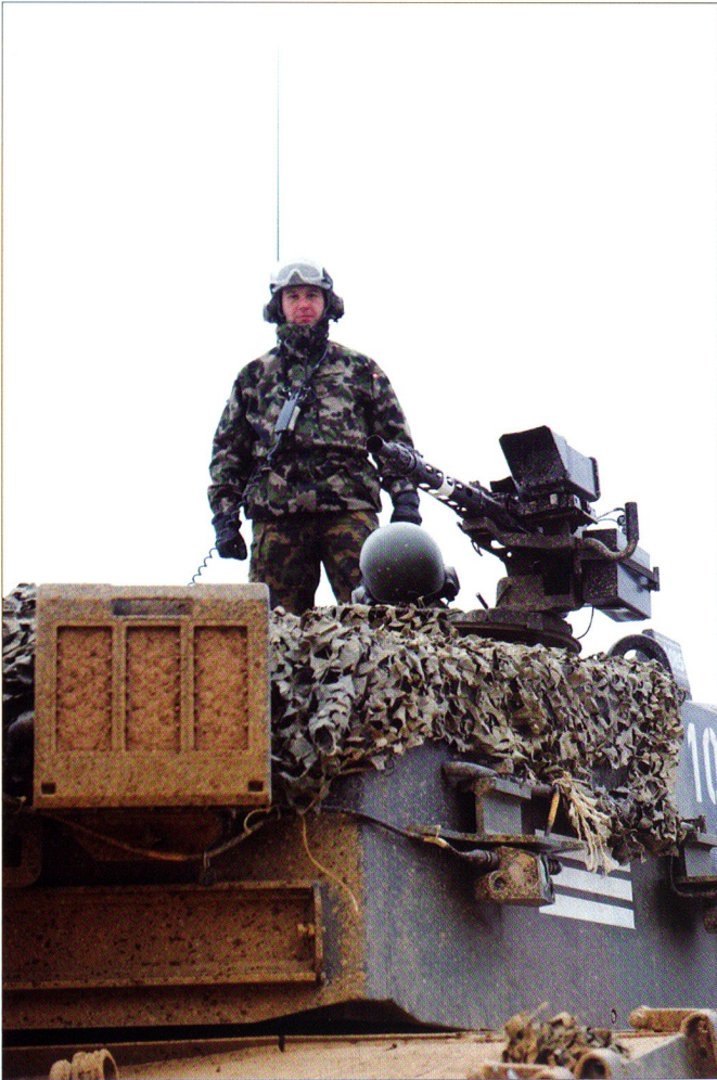
Le cdt cp sur son « bahut. »