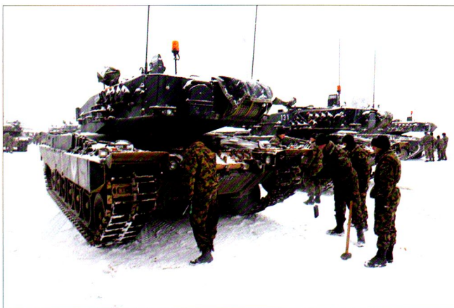
Halte, nouveau but : mettez les crampons à neige...