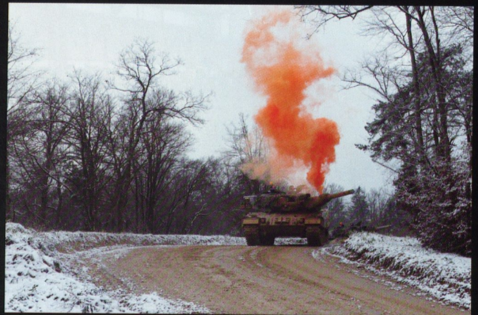
Le char de tête (plt Auffranc) est touché à la sortie de Combe la Casse.