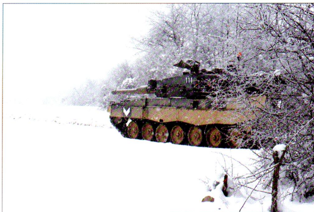
Premières sorties dans la poudreuse...

Le nouvel ordre de bataille de la compagnie de chars présente deux changements importants. Le premier est l'intégration d'une section supplémentaire de logistique, avec des éléments sanitaires et de dépannage ( Büffel ). Le deuxième concerne la formation des sections de combats, qui passe de trois à quatre chars. Malgré cela, la