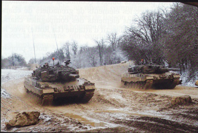
La 17/1 pousse très fort dans Combe la Casse...