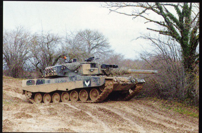
Les chars de la 17/1 observent, avant la poussée.