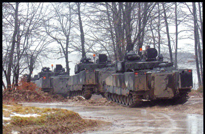
Une section de CV90 se prépare à quitter son secteur d'attente pour un nouvel exercice.