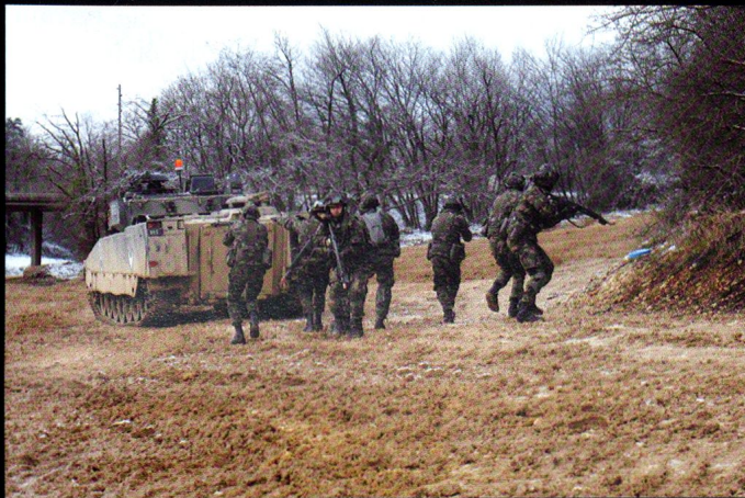
Débarquement des grenadiers de chars à Combe la Casse.