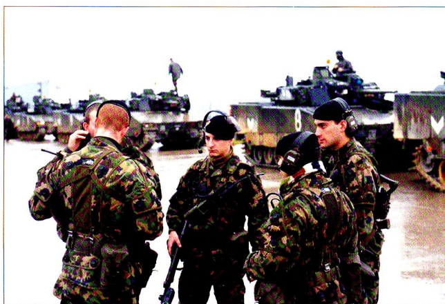
Derniers préparatifs entre le chef de section, le chef de la formation débarquée (CAF) et les sous-officiers.

Chaque grenadier de char de combat reçoit à son entrée en service un équipement personnel spécialement formaté à son nom, avec une carte individuelle. Il s'agit d'une tenue appelée PAB que l'on met par-dessus son harnais. De plus, il touche un fusil d'assaut déjà formaté SIM (simulation). Les chars, sont également équipés de simulateur de tir performants, ainsi que de réflecteurs avertissant le commandant de véhicule s'il est touché ou en mesure de continuer le combat. Plusieurs possibilités existent pour le char : totalement (« total kill ») ou partiellement détruit. (« mobility kill »). Dans le premier cas, il faut désormais tenir compte du fait que les grenadiers de combat embarqués dans le véhicule peuvent alors être touchés, même à l'intérieur du char !