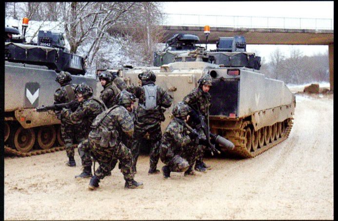
Ouverture de Combe la Casse avec une section de grenadiers de chars débarquée.