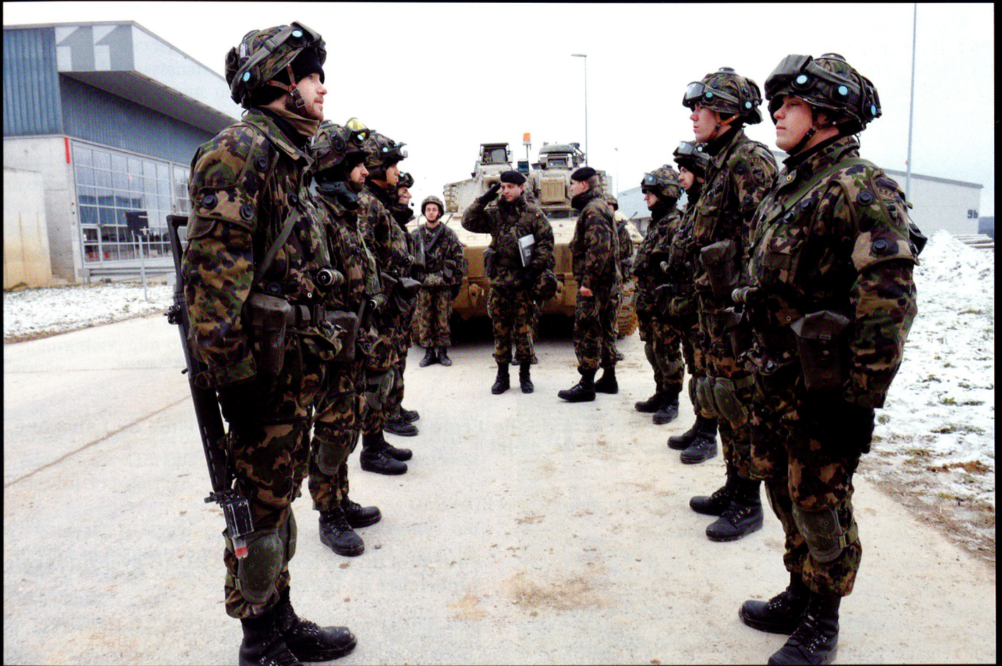
ZOUAVE : Annonce de la 17/4 au commandant de bataillon, avant le départ pour l'exercice.