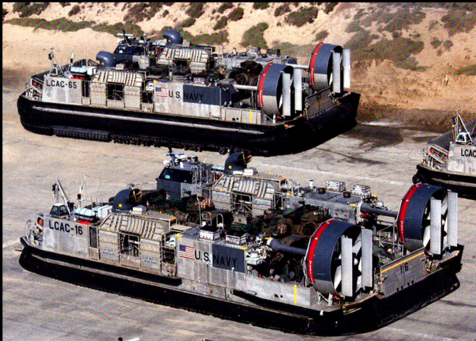
Le LCAC, entré en service en 1986, peut emporter jusqu'à 60 tonnes de charge (75 tonnes en surcharge) à plus de 40 noeuds.