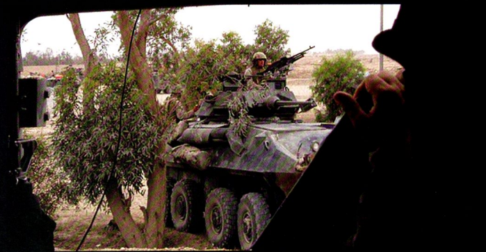
Véhicules d'exploration LAV Piranha à Fallujah, Irak.