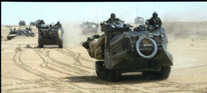
AAV-7 et M1 Abrams du Corps des Marines, en Irak.