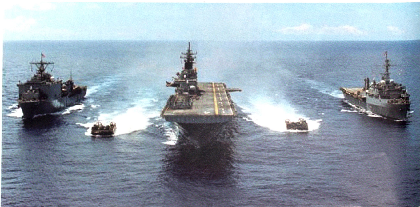
Un Expeditionary Strike Group peut emporter jusqu'à 2'200 Marines.