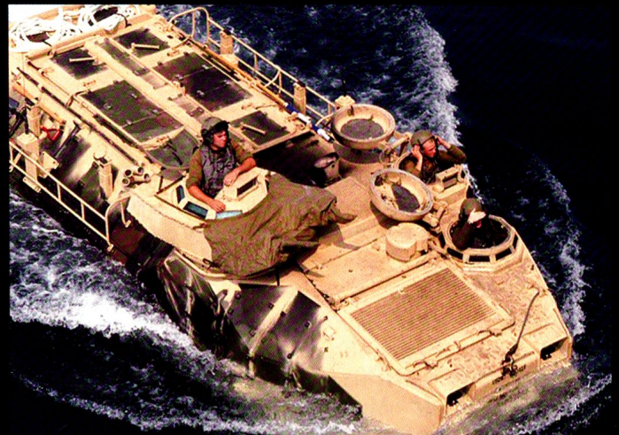
L'AAV-7 pèse 29,1 tonnes et peut emporter 3+25 Marines. Malgré son surblindage, il accuse son âge.