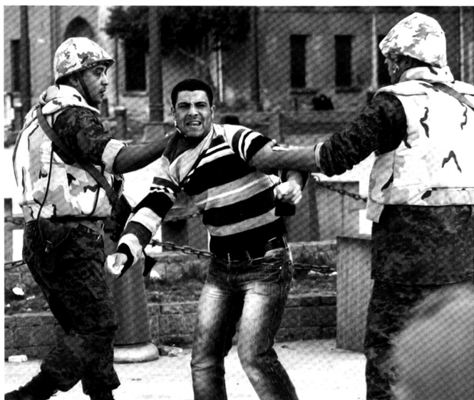
Les forces armées et paramilitaires sont présentes pour éviter les débordement, y compris pour protéger les musées.