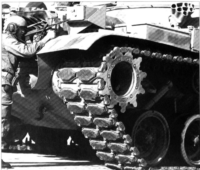
Prise de position de chars M60 tunisiens.