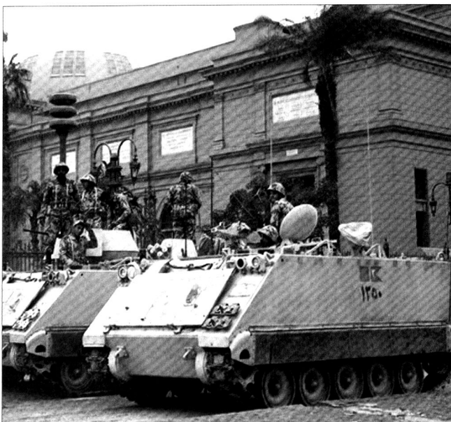
Scènes d'émeutes au Caire, contre le président égyptien Moubarak.