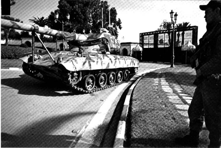
Une unité blindée prend position dans la résidence du président tunisien Ben Ali. Pour mémoire, ces engins sont des chasseurs de chars Kürassier d'origine autrichienne...