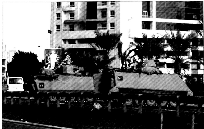
Une unité d'infanterie mécanisée entre dans Manama, la capitale du Bahreïn.