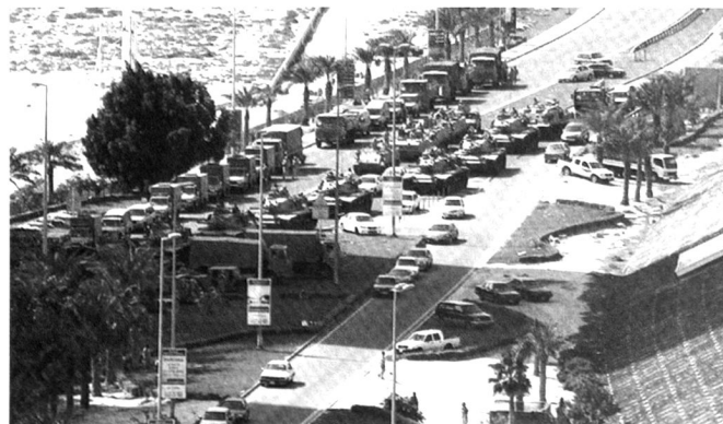
Base de départ et entrée d'une formation blindée bahreïni dans les rues de Manama.

ces derniers agissent selon les règles et on bafouillé tout au long de la première phase de l'insurrection égyptienne. La démocratie est une enveloppe institutionnel, qui implique de nombreux blocs de construction : un système judiciaire indépendant, la primauté du droit, l'existence d'institutions civiles et politiques, les libertés d'expression, de réunion et d'association, des élections libres et universelles et à la veille d'une société libérale. La culture de la société arabe n'a pas toujours évolué sur un chemin vision libérale et multipartite. Sa tendance à accepter les traditions sans examen critique, n'est pas propice à l'acceptation des différences dans la pensée et des valeurs. Et cela a été renforcé par l'échec des régimes nationalistes laïques et les horizons fermés de leurs ordres dictatoriaux. Il devrait y avoir pleine conscience de ces facteurs d'autolimitation dans la perception de l'avenir. Toutefois, ces insuffisances ne doivent pas arrêter la marche vers la démocratie. C'est un argument erroné et historiquement non valide de dire que la démocratie a besoin préparation spéciale ; tous les peuples ont commencé à partir de zéro et appris sur le tas au fur et à mesure.