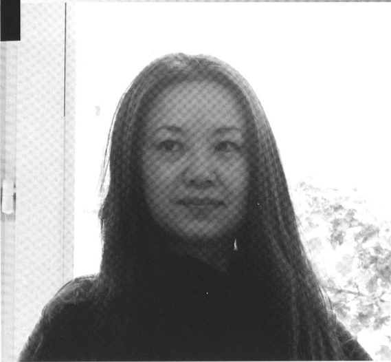
Shan Sa.