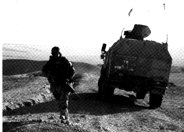
Un véhicule protégé Dingo près de Mazar-e-Sharif, Afghanistan, 2009.

Un autre Dingo , pris en photo dans la province de Kunduz.