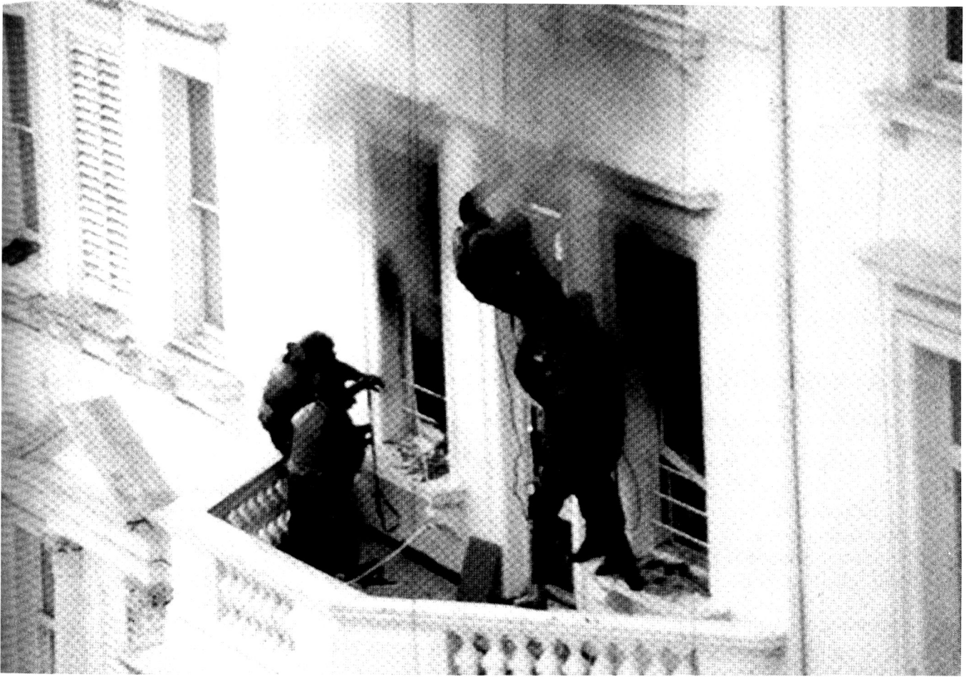
La libération de l'ambassade d'Iran, place St James à Londres en 1980 par le SAS, l'une des opérations les plus connues.