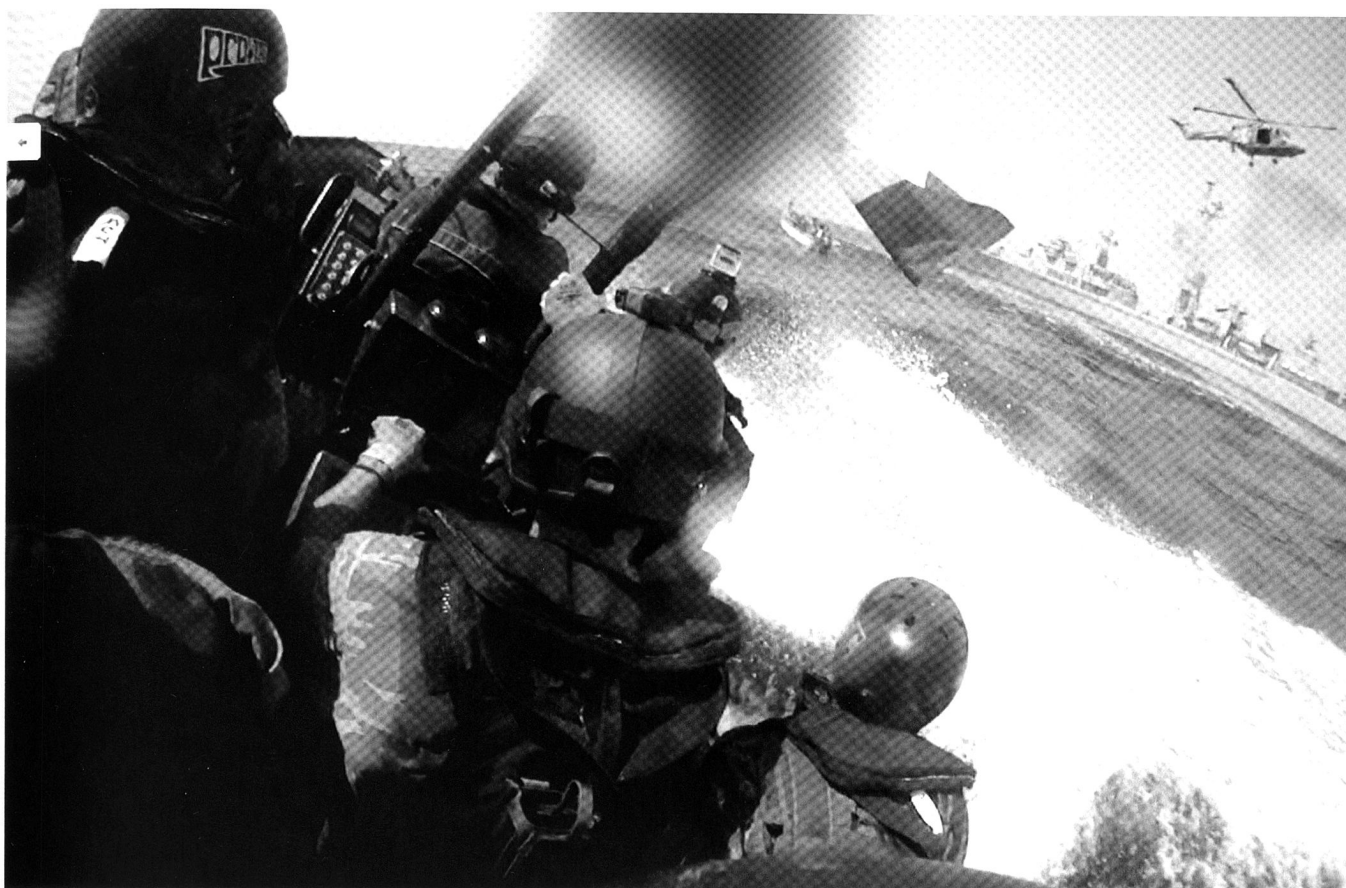
La frégate Aconit , engagée dans l'affaire de la Tanit .

presque 5 mètres et large de 60 centimètres. En raison de la végétation et du relief entourant l'objectif, une insertion par aérocordage sur ce dernier était la seule méthode possible.