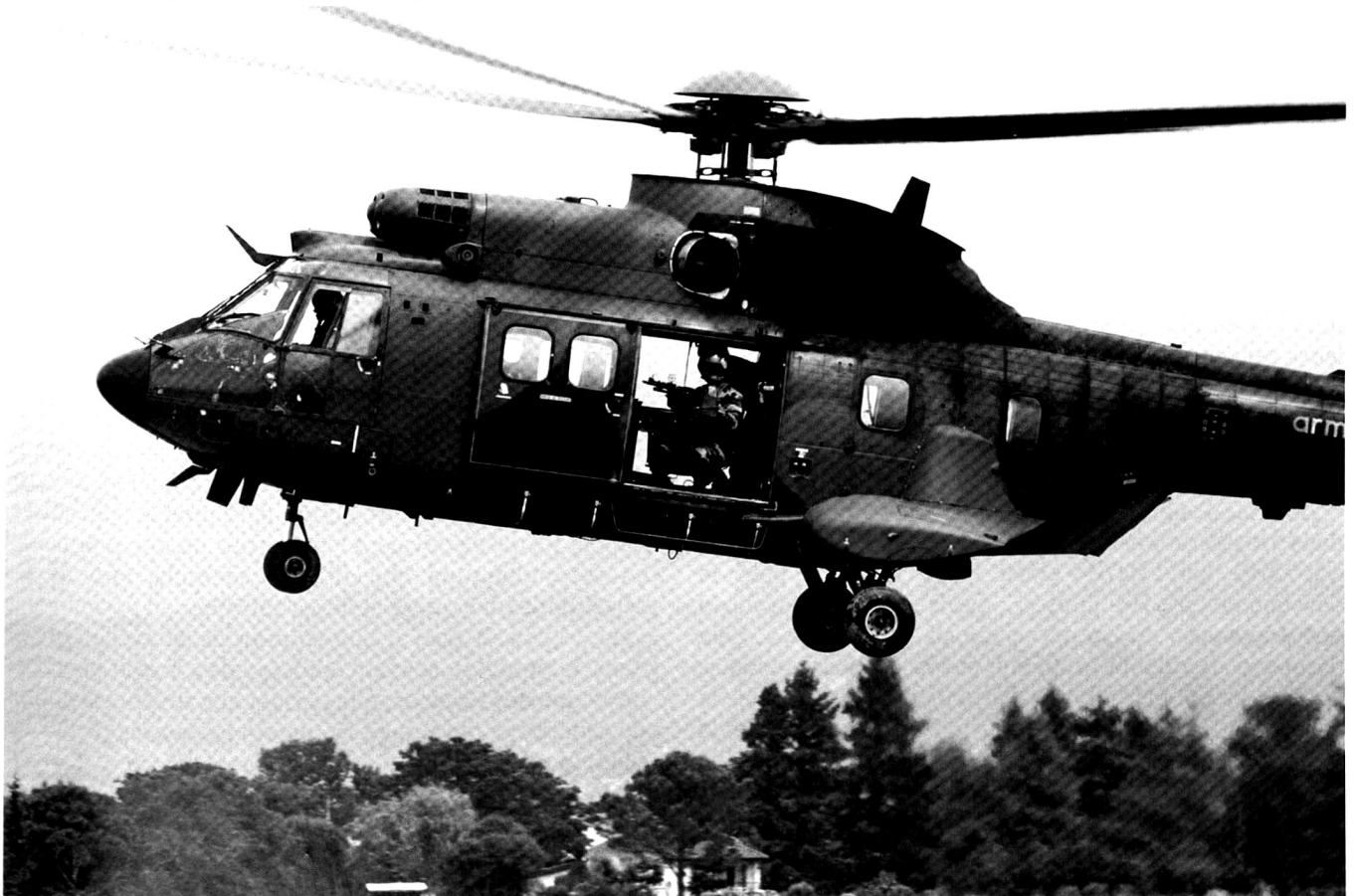
Un hélicoptère Cougar de l'Armée de Terre française.