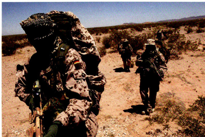
Des éléments du KSK allemand en patrouille.

L'Afghanistan a été depuis presque 10 ans le plus important secteur d'engagement des forces spéciales allemandes, sous commandement américain puis dans le cadre de la FIAS, en parallèle d'engagements ponctuels, notamment en vue d'évacuer des ressortissants menacés, comme en février de cette année en Libye. Même si ces engagements sont restés d'une ampleur modérée, avec en moyenne près de 10% des effectifs constamment déployés, ils ont rendu encore plus difficile la montée en puissance en particulier du KSK, qui souffre d'un sous-effectif chronique.