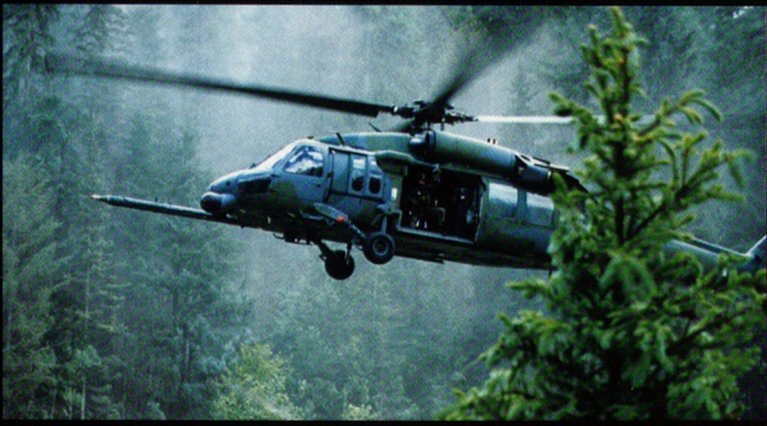
MH-60 et MH-53 (en bas) de l'US Air Force.