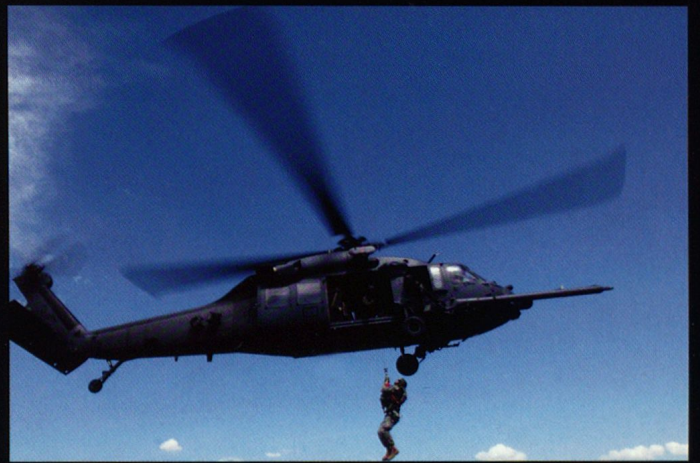
Le MH-60 Pave Hawk est une version adaptée aux forces spéciales, dotée d'une perche de ravitaillement en vol. Le projet de son successeur a pour l'instant été suspendu.