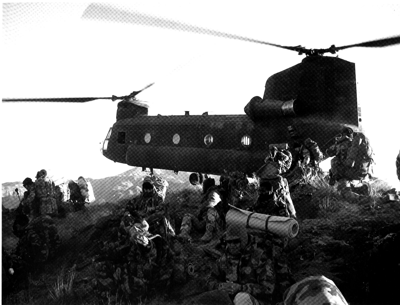
Un Chinook CH-47 procédant à l'insertion de forces spéciales afghanes et américaines.

transport aérien 25 . Les secondes comptent 2 régiments dédiés aux opérations spéciales, mais également capables d'appuyer les forces conventionnelles. 26 Tout compris, l'ensemble doit compter environ 2'400 militaires.