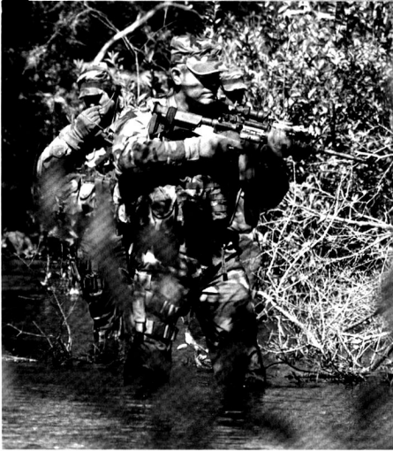
Une patrouille de forces spéciales de l'US Air Force à l'entraînement.