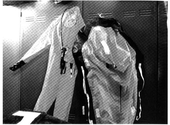
Tenue imperméable et auto-gonflable pour la sortie d'urgence des sous-marinières. N.B. Contrairement à cette tenue standard pour les sous-marinières, celle en dotation aux hommes du SPAG a été créée exprès et sur mesure par la société 100% italienne DiveSystem.