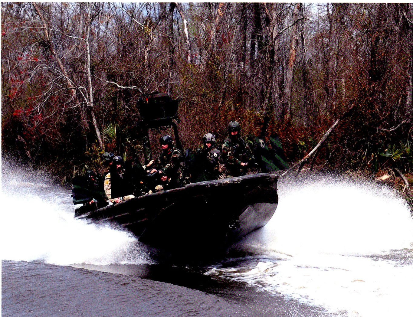
Des Navy SEALs lors d'une démonstration avec munitions de combat.

depuis 2006 une composante issue du corps des Marines, 4 et tout récemment une composante d'instruction.