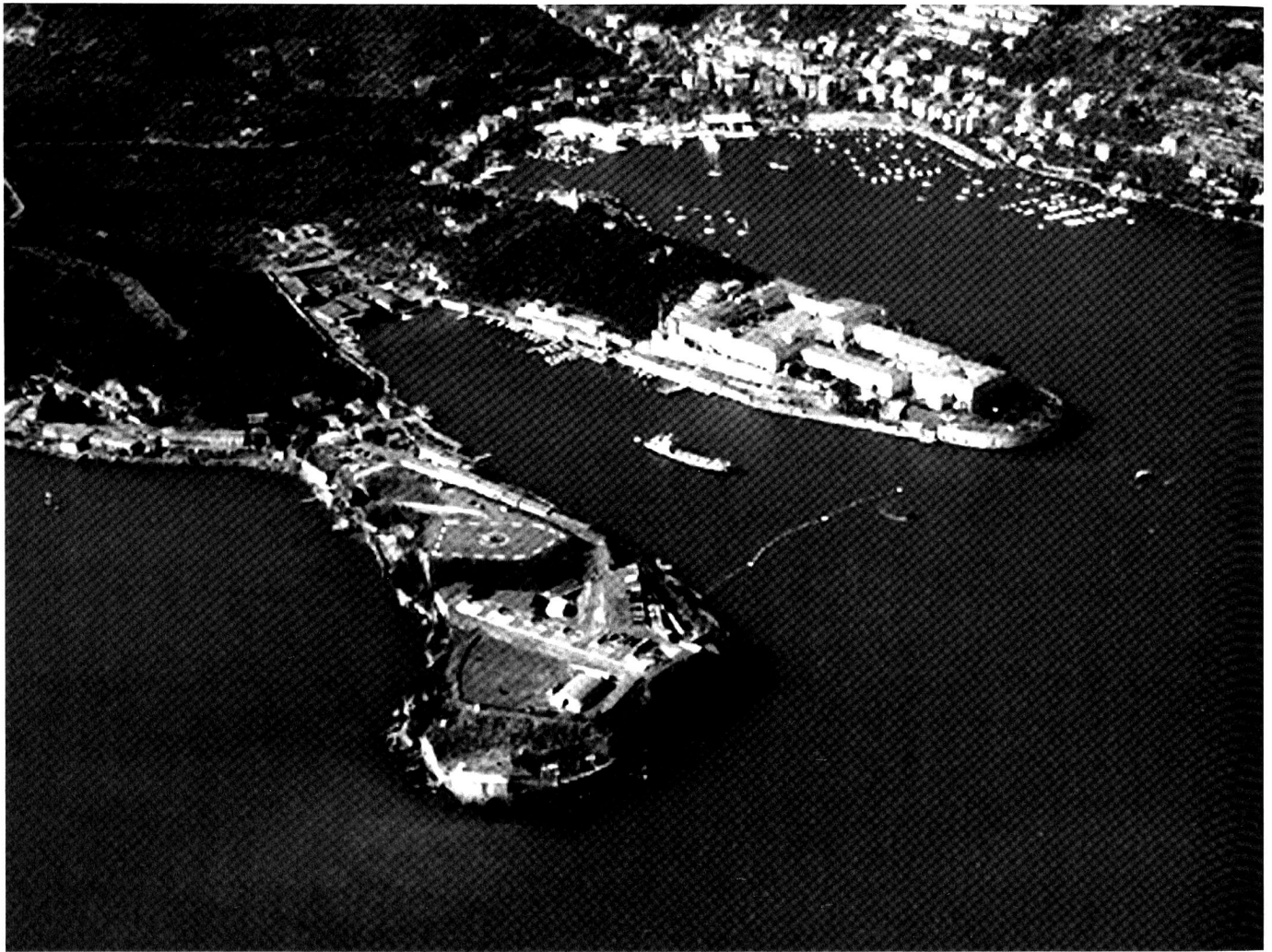
La base du COMSUBIN au Varignano, Le Grazie, Portovenere, La Spezia.