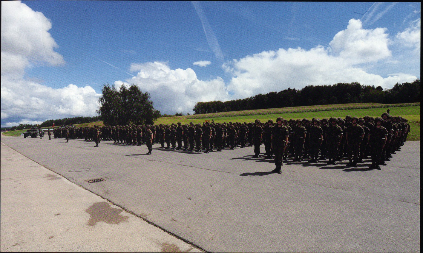
Ci-dessus : Prise de l'étendard du bat chars 17, le 15.08.2011 à Bure. Ci-dessous : donnée d'ordres de l'exercice de bataillon, à Nalé ; et visite de corps à la fin du CR.