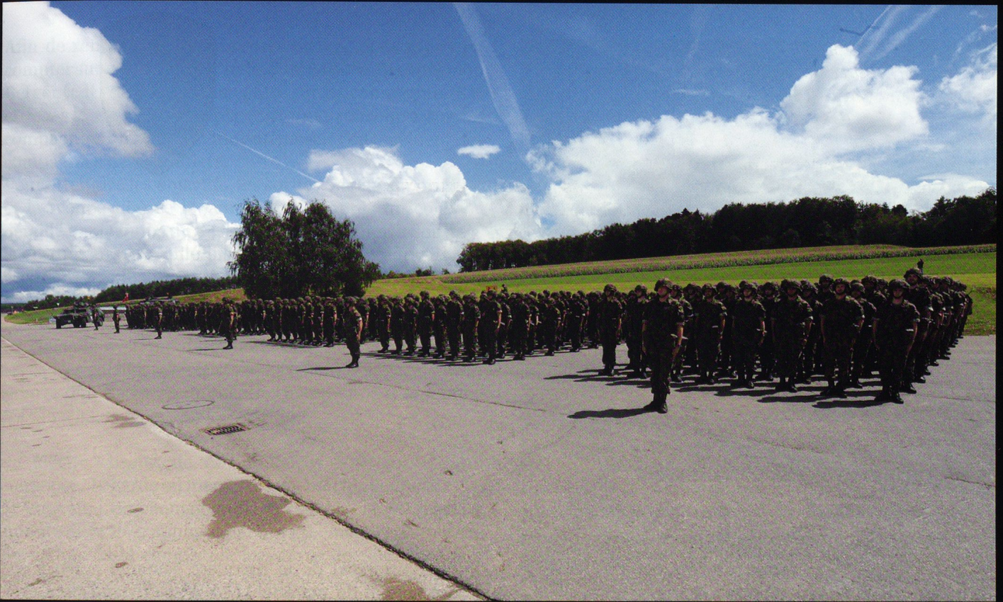
Ci-dessus : Prise de l'étendard du bat chars 17, le 15.08.2011 à Bure. Ci-dessous : donnée d'ordres de l'exercice de bataillon, à Nalé ; et visite de corps à la fin du CR.