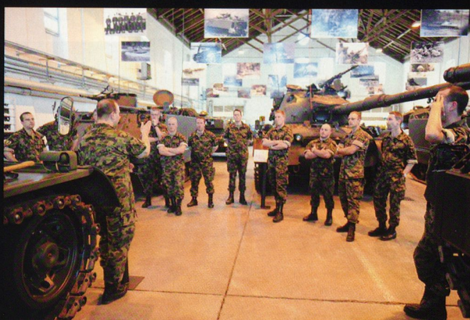
Le cap Barca (S3) retrace le développement du char suisse 61.