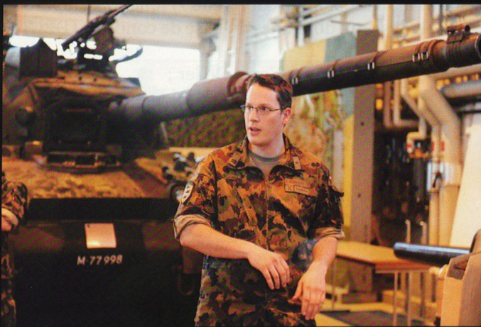
Le cap Penseyres (S6) évoque ses souvenirs sur le char de grenadiers 63 (M113).