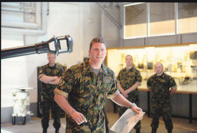
Le cap De Haller (cdt 17/2) évoque le chasseur de char G-13, acquis en 1947.