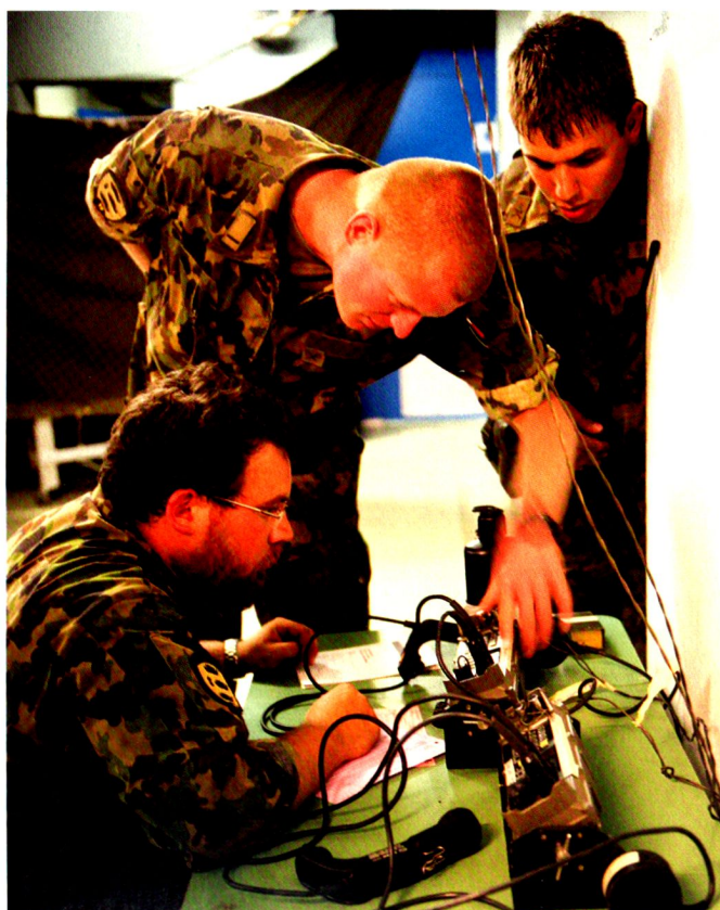
Le commandant de la cp EM vérifie les liaisons.