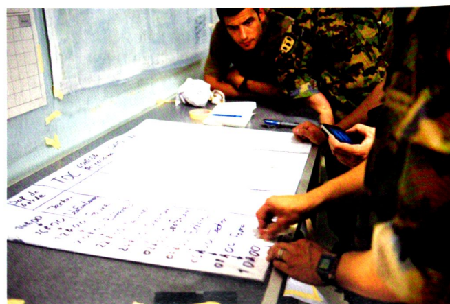
Au PC mobile, la relève et la garde sont assurées en permanence.