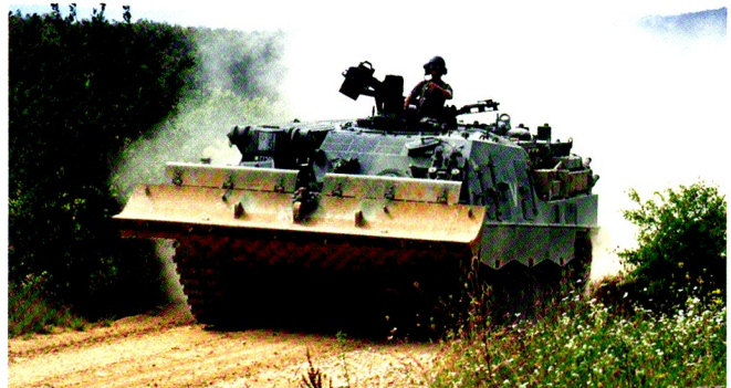
L'équipage du char de dépannage Büffel a vu du pays durant le CR 2011...