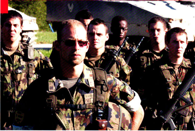
Cp log chars 17