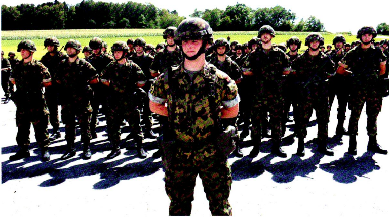
Cp gren chars 17/3