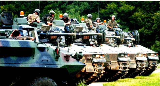
La 17/3 se met en place pour la cérémonie de remise de l'étendard, à Nalé.

Fin de l'exercice de bataillon. La compagnie se rassemble.