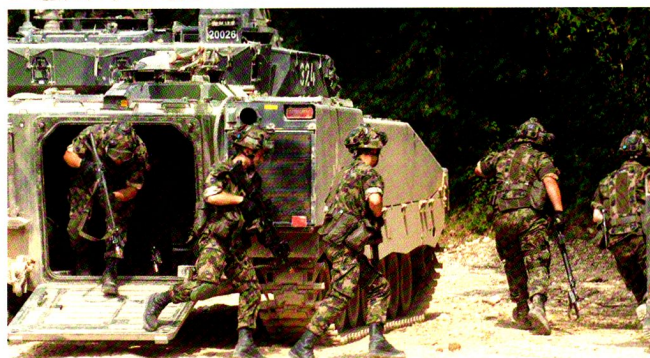
Débarquement et ouverture du Rondat Nord. Arrivée du Büffel.