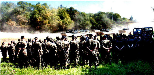
Ci-dessus et ci-dessous : la 17/3 se prépare à une critique intermédiaire à Combe-la-Casse.