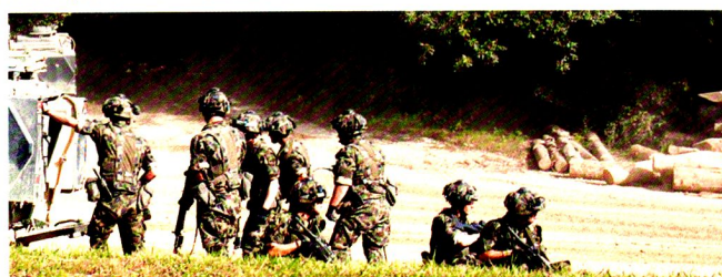
Entraînement des comportements standards à Combe-la-Casse.