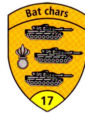
La cp gren chars 17/3 à la prise de l'étendard, le 15 août.