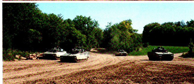
Le franchissement d'un passage obligé -ici le Rondat Sud- a été drillé durant le CR 2011.