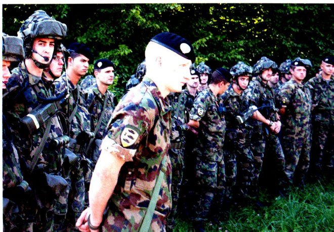
La répétition des exercices permet de gagner la maîtrise et la confiance nécessaires au succès.

Ce que l'on appelle « standard » définit le fait que les soldats d'une même formation agissent de manière uniforme avec discipline. Le principe est que les connaissances et le savoir-faire doivent se compléter au sein d'un groupe pour que celui-ci puisse fournir des prestations d'ensemble : les soldats maîtrisent les armes et les appareils, les chefs, leur technique de commandement. Ce n'est que lorsque chaque membre du groupe maîtrise son échelon et que le chef et les soldats ne se concurrencent pas, mais se complètent, que naît la confiance en la possibilité de parvenir ensemble au succès. Une formation uniforme est donc nécessaire.