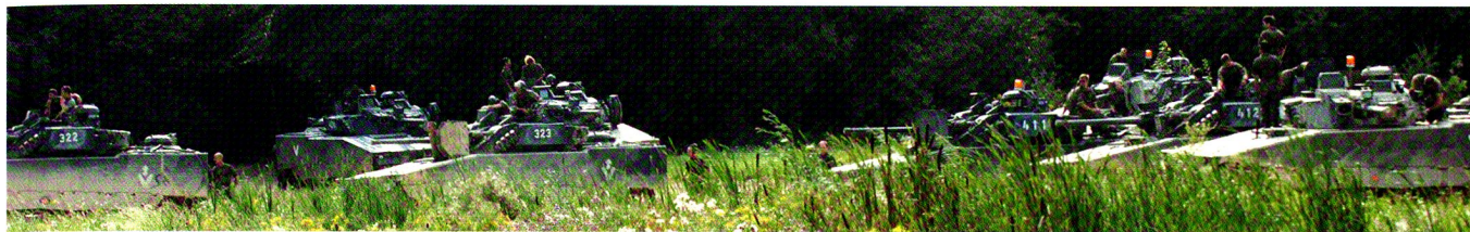
Entraînement intensif : Durant la 2 e semaine du CR, Six exercices de compagnie ont eu lieu chaque jour.

Il faut savoir que suite au raccourcissement des écoles de cadres, un nombre important de techniques et d'instructions spécifiques ne peuvent être assimilées par les cadres de milice durant la formation de base et les effets secondaires commencent à se faire sentir lors de l'entrée en service des nouveaux soldats ou cadres, ce qui renforce la nécessité de l'appui à l'instruction lors des cours de répétition.