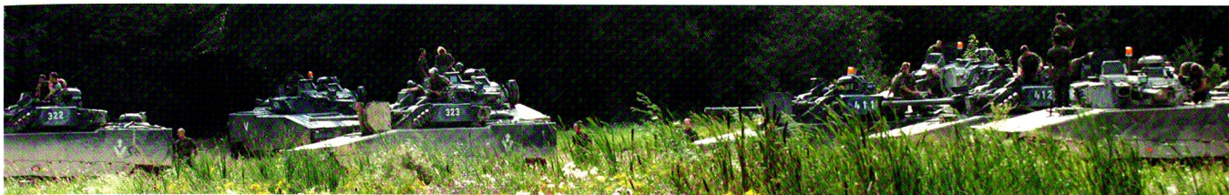
Entraînement intensif : Durant la 2 e semaine du CR, Six exercices de compagnie ont eu lieu chaque jour.

Il faut savoir que suite au raccourcissement des écoles de cadres, un nombre important de techniques et d'instructions spécifiques ne peuvent être assimilées par les cadres de milice durant la formation de base et les effets secondaires commencent à se faire sentir lors de l'entrée en service des nouveaux soldats ou cadres, ce qui renforce la nécessité de l'appui à l'instruction lors des cours de répétition.