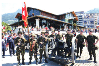
La délégation du bataillon de chars 17, avec la SVO Groupement Est et les artilleurs des Milices vaudoises.

Une de mes motivations et de pouvoir servir mon pays. Je suis engagé politiquement, mais suis aussi président de la fédération suisse des sapeurs-pompiers. Ma préférence est d'être dans la locomotive plutôt que regarder passer