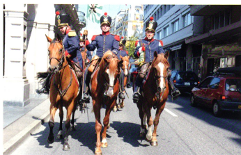
Le défilé, mené par les Milices vaudoises, en ville de Montreux le 1er août 2011.