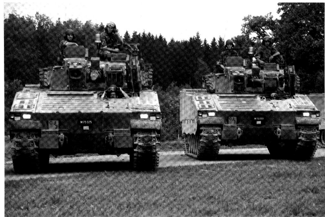
Ci-dessus, tirs de combats à courte distance.

Au-dessous, équipages de grenadiers de chars (cp gren chars 17/3) équipés de systèmes de communication Racal. La radio ne facilite pas toujours les communications.