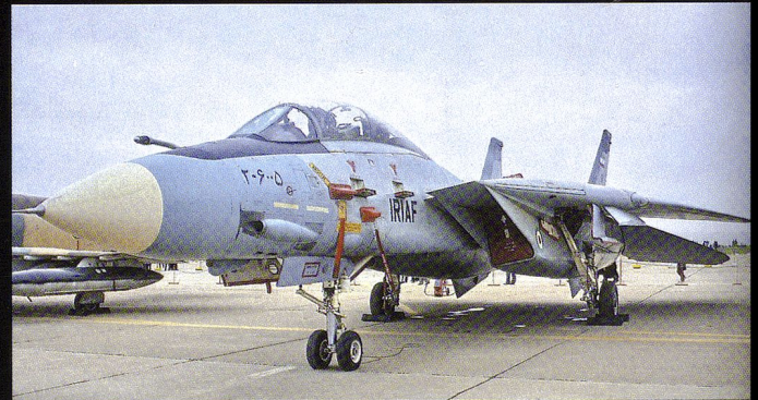
Présentations statiques de F-14 revalorisés.