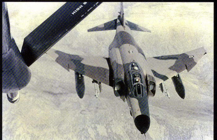
La taille de l'espace aérien iranien exige un emploi récurrent de ravitailleurs, Boeing 707 et 747.