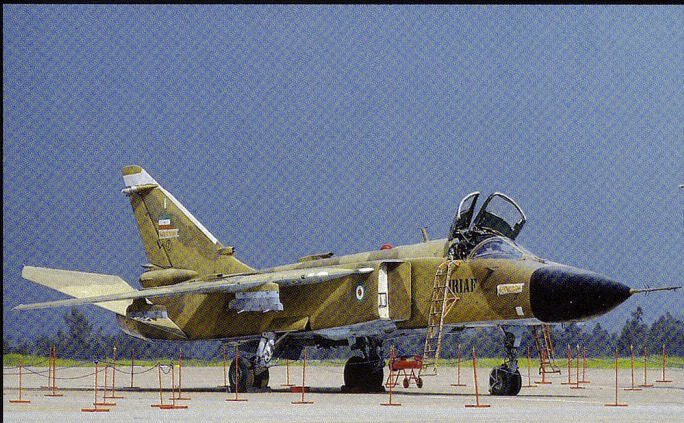
Le Sukhoi 24 est un bombardier tactique. Sans modernisation électronique, il est peu flexible et vulnérable.