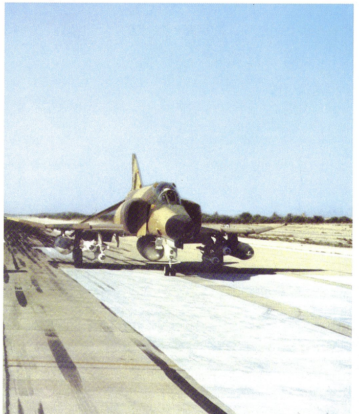
Décollage d'un F-4E armé de 4 missiles AGM-65 Maverick .