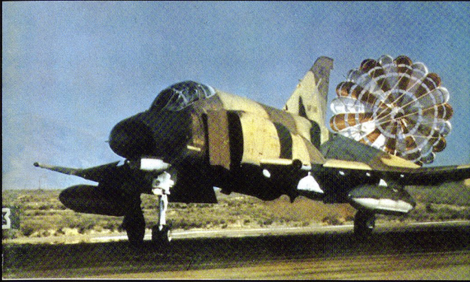
Plus de 100 Phantom servent au sein de l'IRIAF, autant comme chasseurs-bombardiers (F-4E) que pour la reconnaissance (RF-4E).