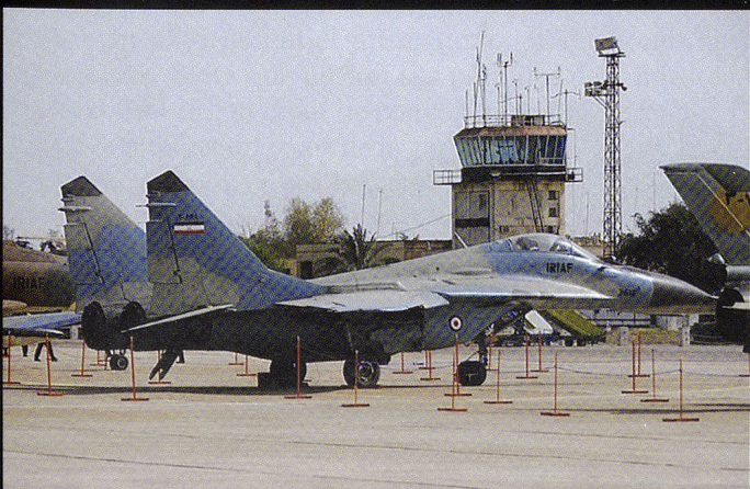
Le Mig 29 est utilisé avant tout comme intercepteur, en l'absence d'un système d'arme air-sol adéquat.