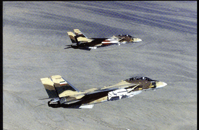
Autre patrouille, autre temps : le missile sol-air Hawk a désormais été adapté au Tomcat .