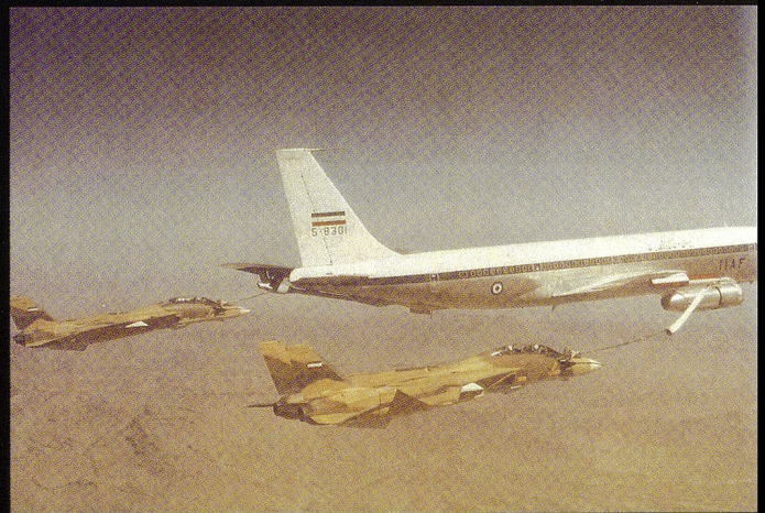
Ravitaillement en vol par un Boeing 707 de l'IRIAF. Cet appareil est généralement connu sous sa dénomination militaire : KC-135.