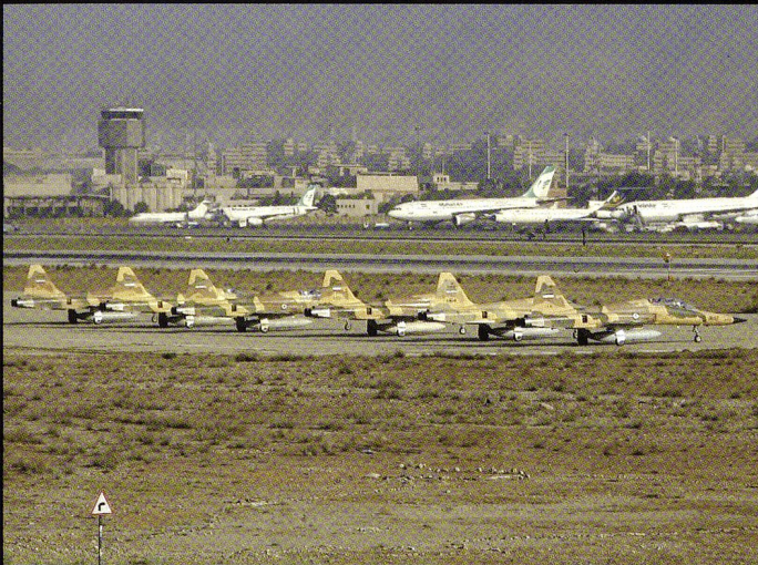
Ligne de vol de F-5E/F sur l'aéroport de Téhéran/Mehrabad.