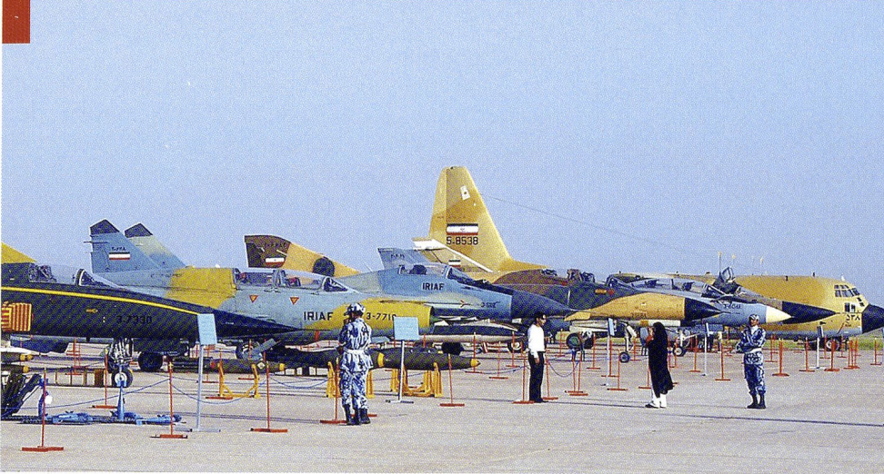
Présentation des appareils de l'Islamic Republic of Iran Air Force (IRIAF), de g. à d.: Seaqah , F-7, Mig 29, F-4, F-14, Su 24 et C-130.