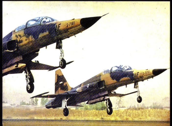
Décollage de deux F-5B pour un vol d'entraînement, chargés de conteneurs de bombes d'exercice.