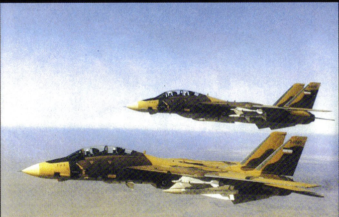
Patrouille aérienne (CAP) de deux Tomcat armés de Sidewinder , de Sparrow et de Phoenix .