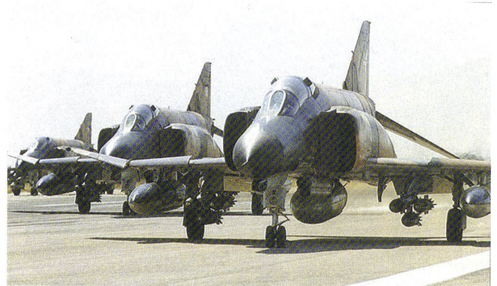
F-4E armés de bombes Mk.82 et de nacelles de contre-mesures électroniques.