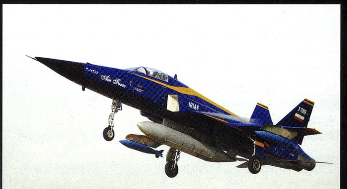
Le Seaqah (éclair) est un développement de l'industrie iranienne, sur la base du F-5E.