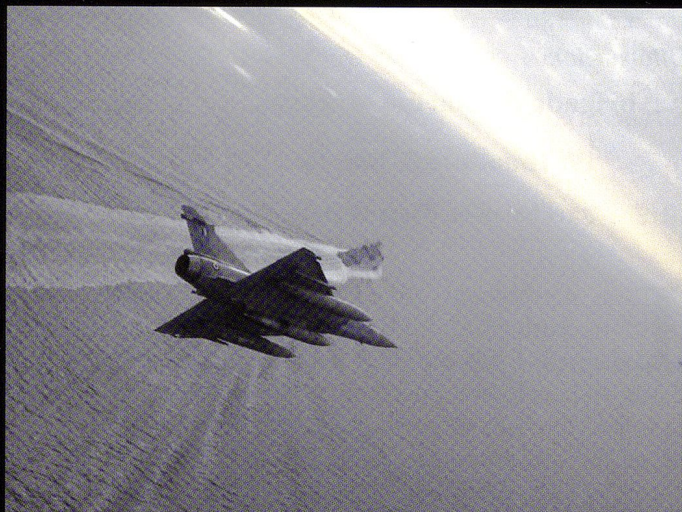
Le Mirage 2000 a démontré ses qualités au-dessus de la mer d'Égée.