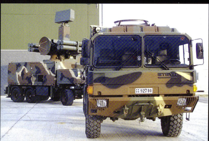
En plus de Stinger , d' ASRAD , de SA-8 , de Hawk et de Tor-M1 , la Grèce engage également des systèmes de DCA Crotale .