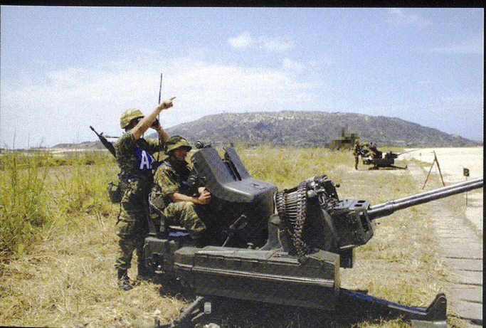
La défense anti-aérienne est constituée notamment de 285 canons Rheinmetal 20 mm bitube.