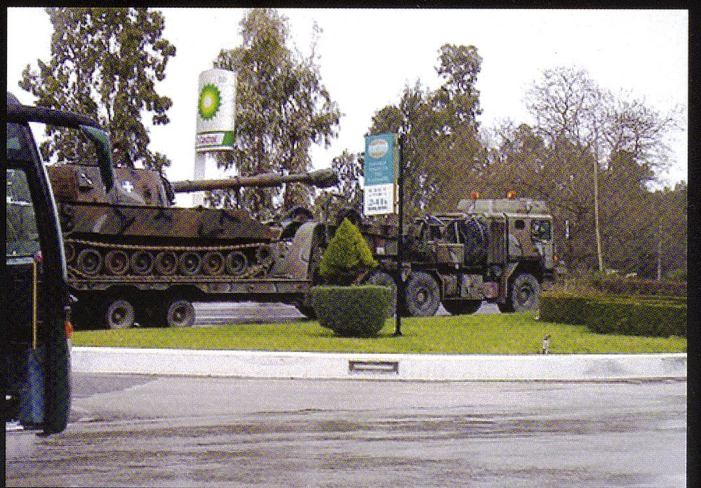
L'appui de feu est essentiellement assuré par plus de 300 M109 de divers types. Mais la Grèce utilise également le M110, le PzH 2000 et... le MLRS.