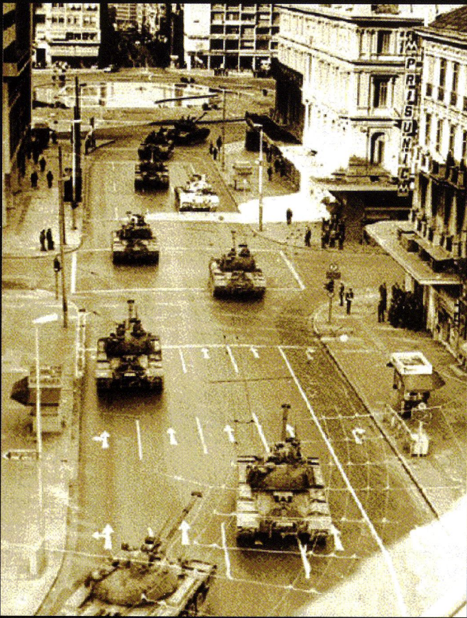
La Grèce dispose encore de 390 M48A5 ex allemands.