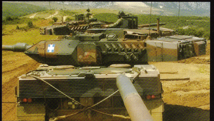
Désormais, 170 Léopard 2A6HEL servent au sein de l'armée grecque.