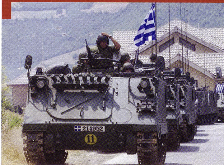
La Grèce a acquis 1'789 M113 A1/A3, servant principalement au transport de troupes.