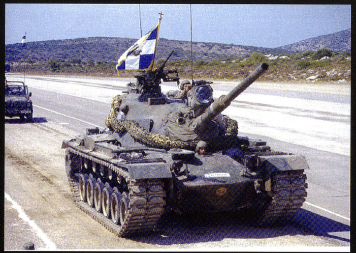
Les M60 ne sont plus en service aujourd'hui.