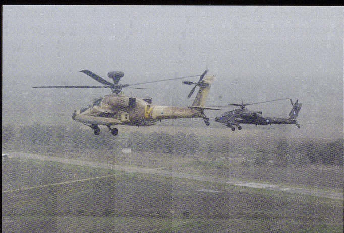
Un AH-64 Apache grec s'entraîne aux côtés d'un appareil israélien.