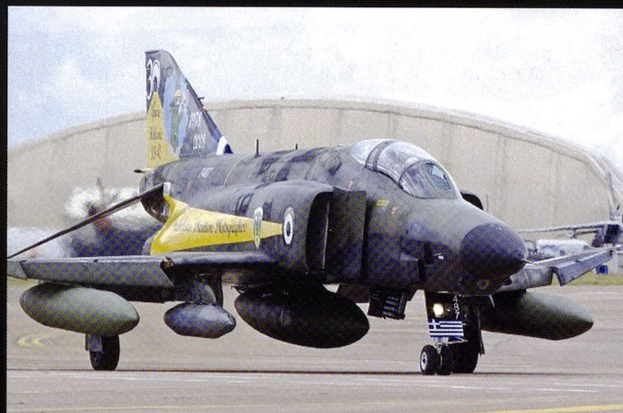
La Grèce est une des dernières utilisatrices du F-4 Phantom II .