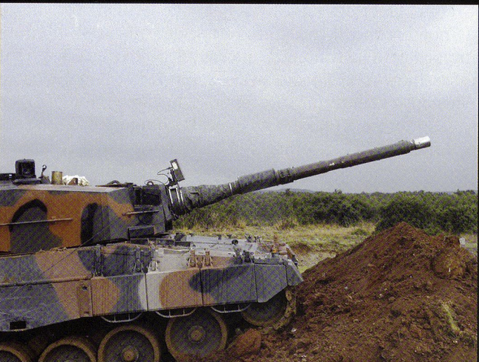
183 Léopard 2A4 ont été acquis, la plupart d'occasion.