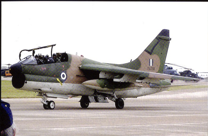
Avec le Portugal, la Grèce est un des rares utilisateurs européens de l'A-7E Corsair II .