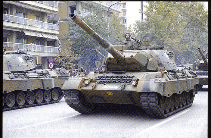
501 Léopard 1A5 et 19 engins améliorés sont encore en service.