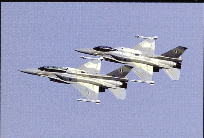
Le chasseur le plus moderne est aujourd'hui le F-16 Block 52 .