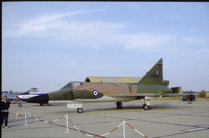
En 1969, la Grèce a acquis 24 F-102 Delta Dagger , dont 5 biplaces.