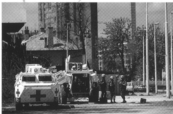
VAB français de la FORPRONU et de la Croix-Rouge dans la capitale bosniaque, en 1996.

Geneva Centre for Security Policy Centre de Politique de Sécurité, Genève Genfer Zentrum für Sicherheitspolitik