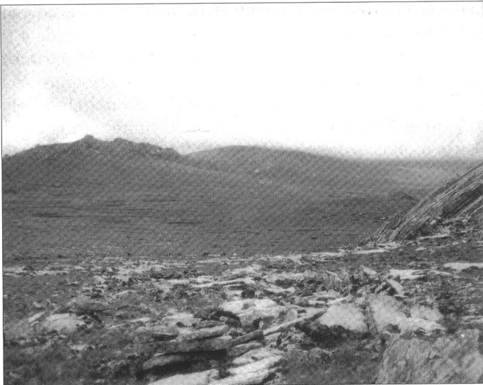
Panorama entre Mt William et Mt Tumbledown.

Le meilleur moyen pour résoudre ce problème est l'entraînement. Aussi dur, aussi réaliste et aussi souvent que possible. Les personnes confrontées au combat seront effrayés et exerceront leur propre jugement. De plus, ils l'admettront rarement et donneront alors à leurs chefs une fausse impression des risques ou des possibilités. Si les personnes ne se connaissent pas étroitement, ceci peut conduire à des situations très dangereuses. Ces circonstances devinrent communes pour les troupes terrestres argentines, une fois que le front commença à se désintégrer, que des soldats se retrouvèrent à combattre parmi des soldats ou des unités qu'ils ne connaissaient pas, sous les ordres de chefs qu'ils n'avaient jamais rencontré jusqu'alors.