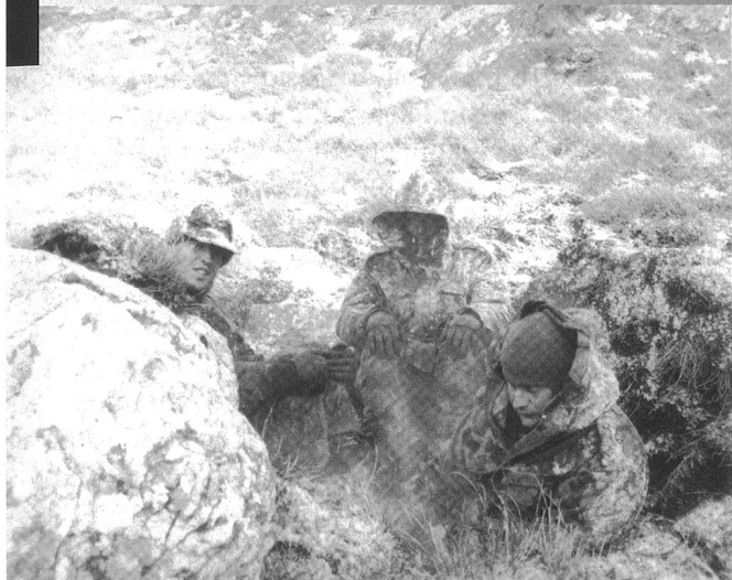
«Brewing up» - le thé est servi sur Mount William.