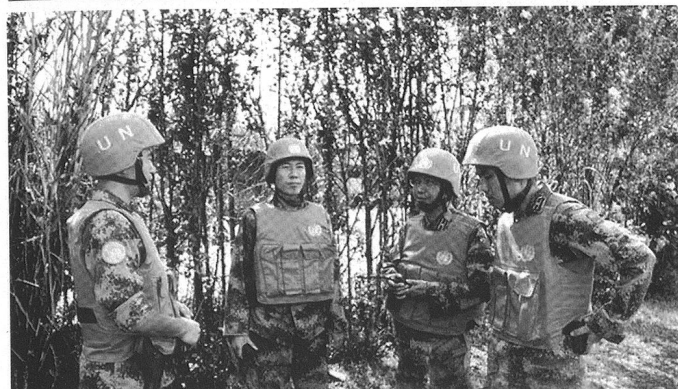
La République populaire de Chine a considérablement augmenté ses engagements au profit de la paix. La barre des 2'000 militaires a été franchie en 2007.

En conclusion, si les pays émergents peuvent s'inscrire en faux contre des politiques occidentales jugées inappropriées ou dangereuses pour la bonne gouvernance en matière de sécurité et les principes y afférents, une confrontation dans le domaine du maintien de la paix ne semble pas inéluctable. Peut-être également parce que de telles opérations, qui ne sont pas la guerre, ne revêtent pas un caractère stratégique aussi important pour les Etats qui les mettent en œuvre.