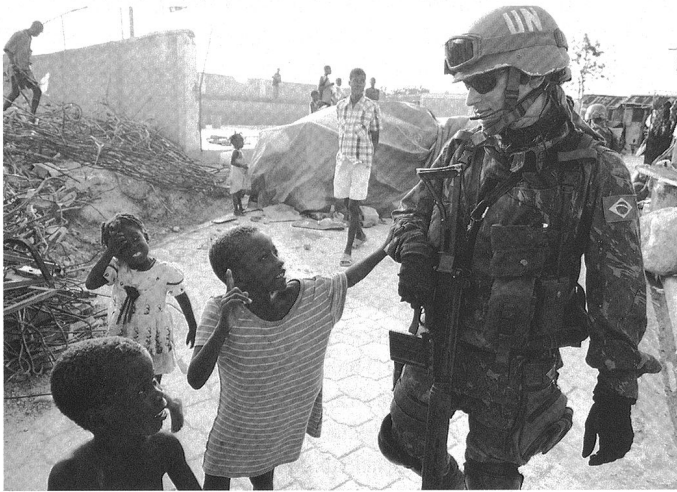
Un casque bleu brésilien à Cité Soleil (Haïti).