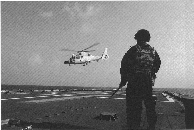
Au large de la Somalie, les Forces spéciales chinoises opèrent à partir de navires rapides ou d'hélicoptères - ici un Dauphin produit sous licence.