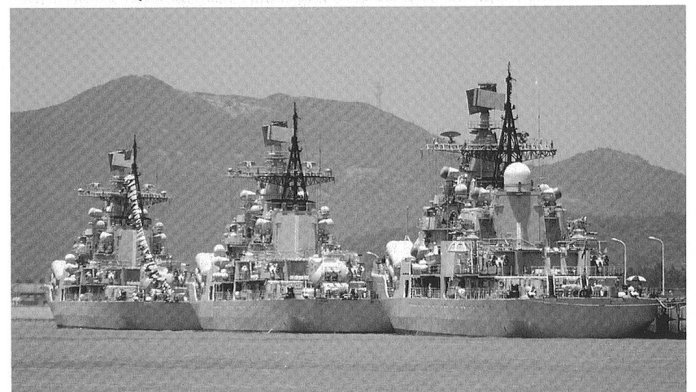
Trois des quatre destroyers d'origine russe Sovremenny , au mouillage à Dong Hai.