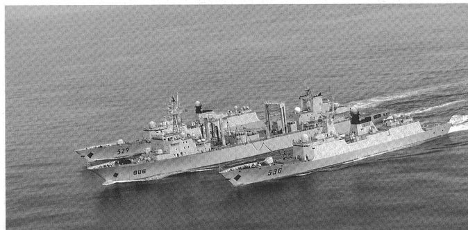
Deux frégates en cours de ravitaillement : le Xuzhou (FFG 530) et le Zhoushan (FFG 529), Type 054A/ Jiangkai II .