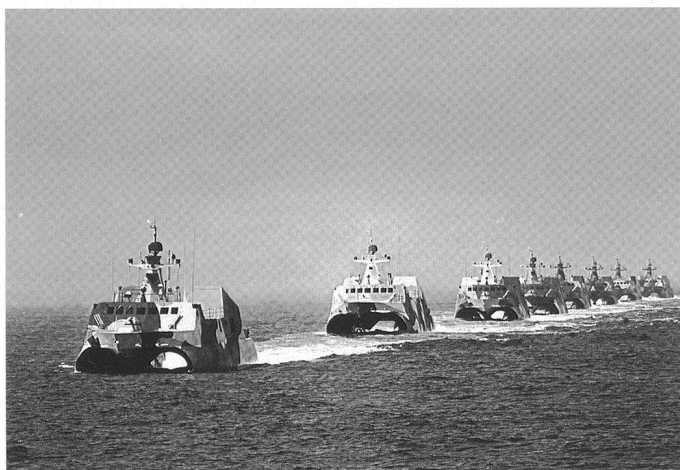
Les chantiers de Qiuxin, près de Shanghai, produisent le navire d'attaque rapide Houbei (Type O22), qui dispose d'une coque catamaran et de caractéristiques furtives.

ces opérations, donc incapable de mener à bien les tâches de souveraineté qui lui incombent, en particulier vis-à-vis des disputes avec le Vietnam ou plus récemment les Philippines.