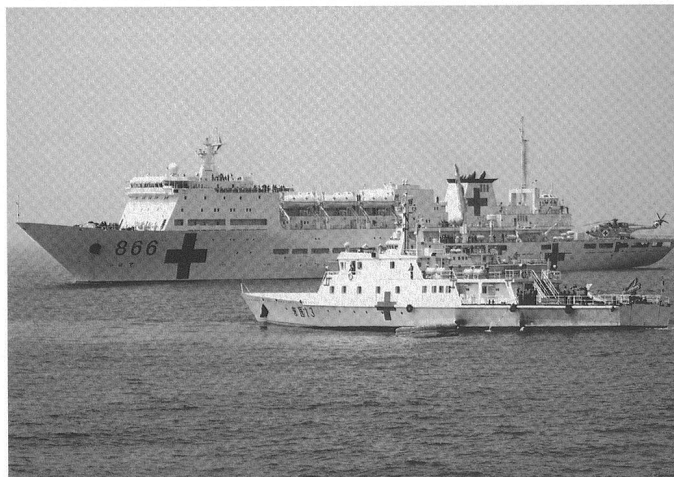
La Marine chinoise est également un acteur de la diplomatie navale et du « soft power, » à l'instar de ces navires hôpitaux.

Plusieurs navires d'entraînement, à l'instar du Zheng He et de la frégate Mian Yang ont visité la Nouvelle Guinée, le Vanuatu, le Tonga, la Nouvelle Zélande et l'Australie, participant à des exercices et des opérations de relations publiques. 6 En 2002 déjà, la PLAN avait réalisé un tour du monde avec deux navires, le Quingdao de ravitaillement (AOR 575) et le destroyer Taicang (DDG 113). Depuis, des visites régulières ont lieu, notamment en Russie.