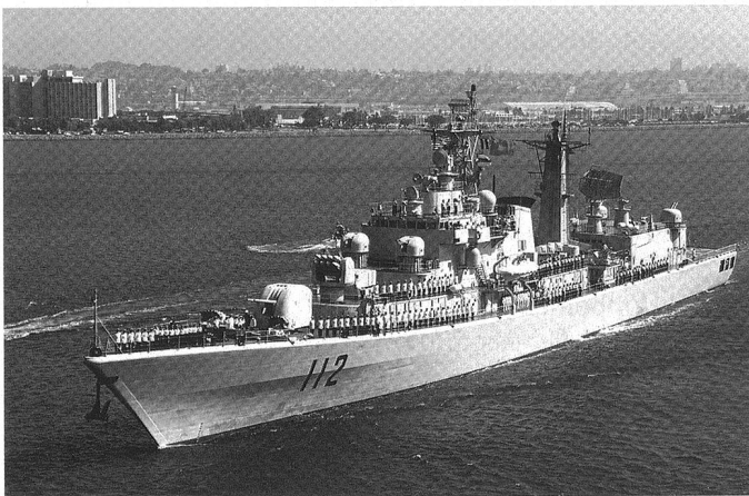
Le destroyer Harbin (DDG 112, Type 052).