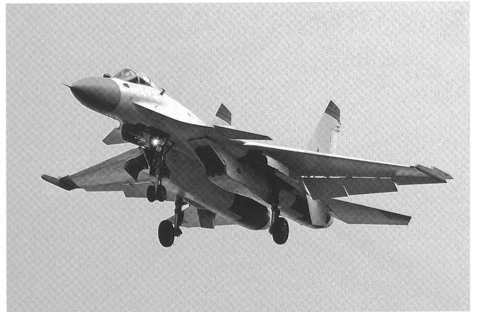
Un modèle de présérie du chasseur-bombardier embarqué J-15.

Plusieurs experts mettent en question l'efficacité et la coordination des moyens, les navires chinois suivant de très près les convois, au lieu de tisser avec les marines étrangères un filet de protection tout au long des trajets. Bien sûr, les engagements extérieurs permettent à la PLAN de s'améliorer. Mais ces opérations créent des remous en Chine, où d'aucuns critiquent leur coût excessif. On fait notamment valoir que les aspects logistiques et de maintenance ont été largement sous-estimés, la plupart des hélicoptères revenant de quatre mois de missions dans l'air marin nécessitant une réfection complète et onéreuse. On constate également, en interne, que la quasi-totalité de la flotte du Sud est désormais engagée à