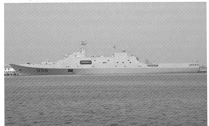
Le navire de débarquement LPD 998 Kunlun Shan . Deux unités ont été produites et deux autres sont en construction.