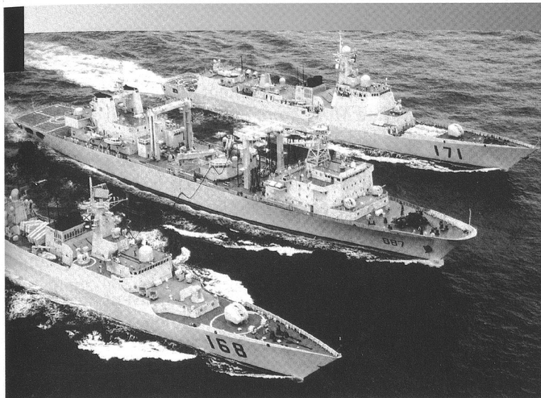
Les destroyers chinois Guangzhou (DDG 168, Type 052B) et Haikou (DDG 171, Type 052C) naviguent vers le golfe d'Aden.