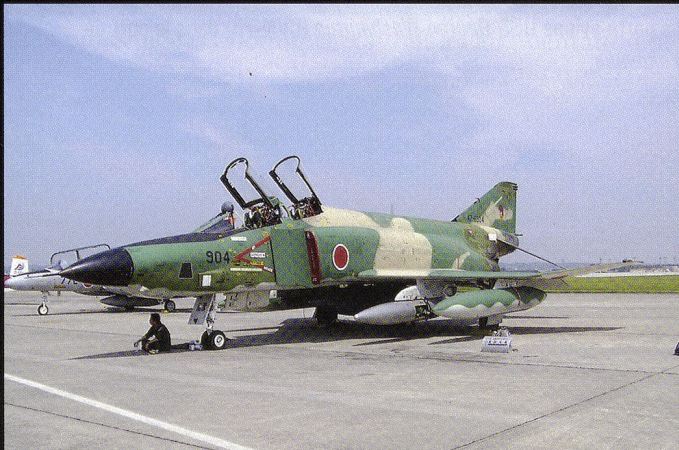
...et 26 RF-4E/EJ Phantom II de reconnaissance non armés.