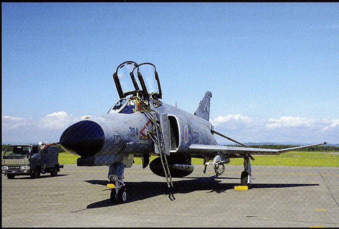
Les Forces d'autodéfense japonaises emploient encore 91 F-4EJ surnommés «Kai»...