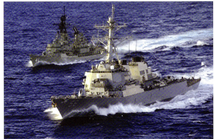
Le destroyer américain USS John S. McCain (DDG-56) en compagnie du destroyer australien HMAS Brisbane (DDG 41) de la classe Charles F. Adams .