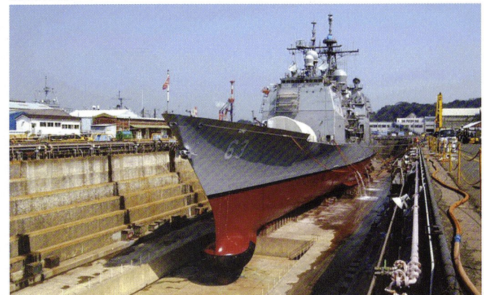
Le croiseur USS Cowpens (CG-63) en cale sèche à Yokosuka .

L'US Navy dispose de 11 groupes aéronavals, dont 10 sont basés aux USA et un au Japon. Il est prévu que six doivent être prêts à être déployés dans les 30 jours et deux en 90 jours. En principe, un groupe est en permanence attribué à la V e flotte en Asie du Sud Ouest et un à la V e flotte dans le Pacifique. La VI e flotte opère en Méditerranée et la IV e flotte en Amérique du Sud. Cette dernière ne dispose en principe pas de porte-avions: ceux-ci lui sont temporairement attribués lors des déplacements dans la zone pour gagner ou rentrer de leur zone d'action attribuée.