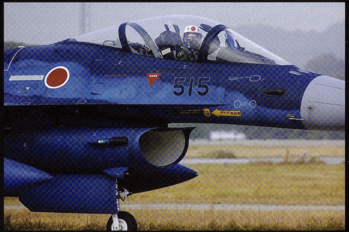
Mitsubishi a laborieusement développé une version locale du F-16, baptisée F-2. Au total, 49 monoplaces et 33 biplaces ont été construits.