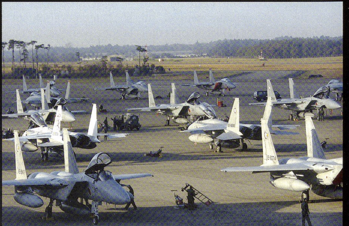
Le Japon est un des principaux utilisateurs du F-15, avec 180 exemplaires en dotation. On sait par ailleurs que le Japon a fait part de son intérêt pour le F-22 et a officiellement commandé 42 F-35.