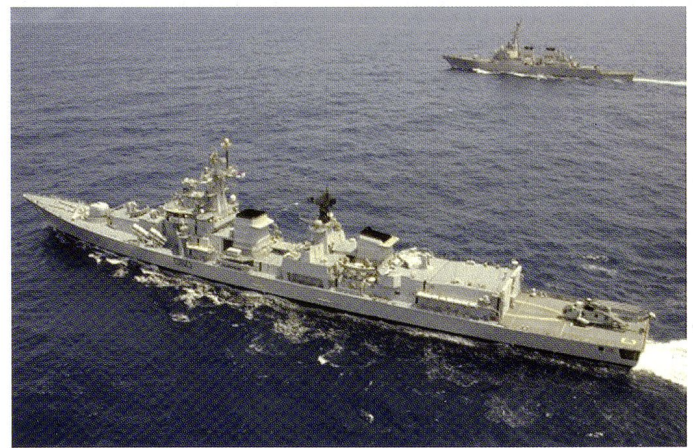
Le destroyer indien INS Mysore (D-60) et le destroyer américain USS Fitzgerald (DDG-62) lors de l'exercice MALABAR 2007.