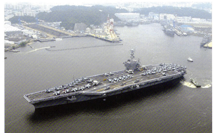
Le porte-avions USS George Washington (CVN-73) dans le port de Yokosuka .