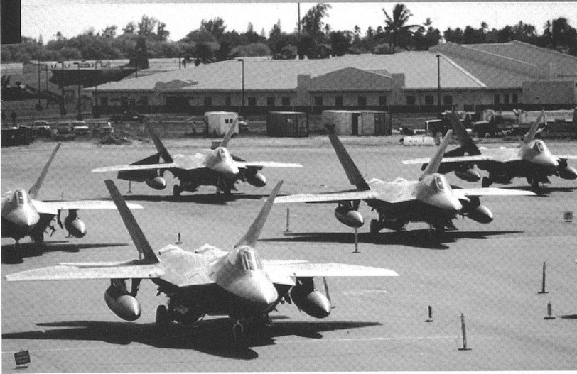
Le F-22 Raptor est l'appareil le plus moderne de l'US Air Force, ici basés à Hickam AFB, Hawaii, 12.02.2007. Ils sont en route pour leur déploiement opérationnel à Kadena, au Japon. Ces appareils appartiennent au 19 th Fighter Squadron. Le déploiement de cet appareil en Alaska et dans le Pacifique montre clairement qu'il est destiné à opérer davantage au-dessus du Pacifique que de l'Atlantique.