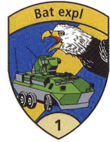
La cp expl 1/1 à Avenches. Toutes les illustrations © Bat expl 1.