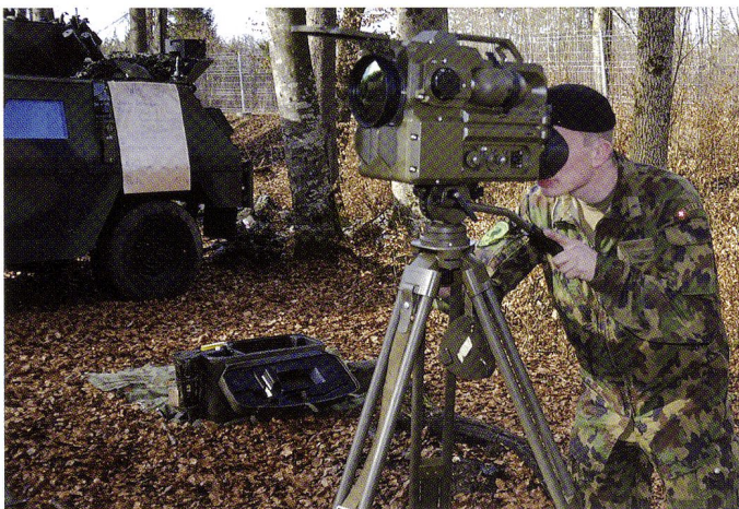
Instruction WBG 90 dans le cadre de l'IAE SUBVENIO.