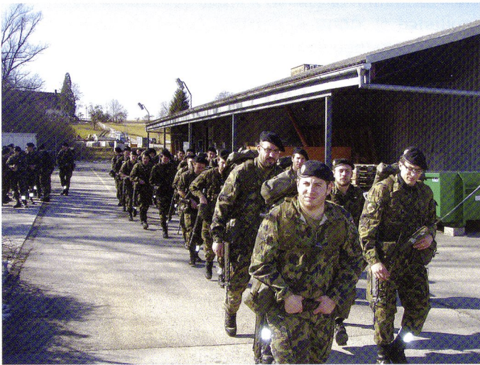
Cp chass chars à la marche d'entrée en service.