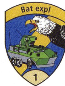
La cp expl 1/1 à Avenches.