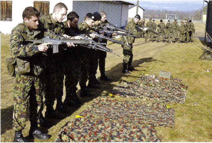
Instruction d'urgence à l'entrée en service.