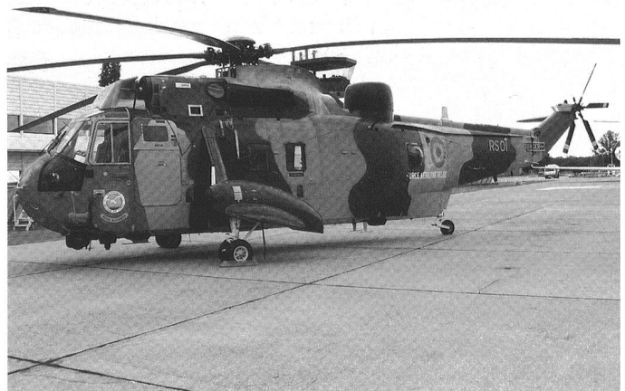
Aujourd'hui, en raison des pressions de l'opinion, les missions de sauvetage et d'aide aux populations ont gagné en importance. Le SH-3 Sea King est en voie de remplacement.

également la fermeture d'installations militaires et feront en sorte que le plan d'investissement 2008-2011 (PIDS) ne pourra être réalisé faute de nouvelle disponibilité en termes de budget d'équipements !