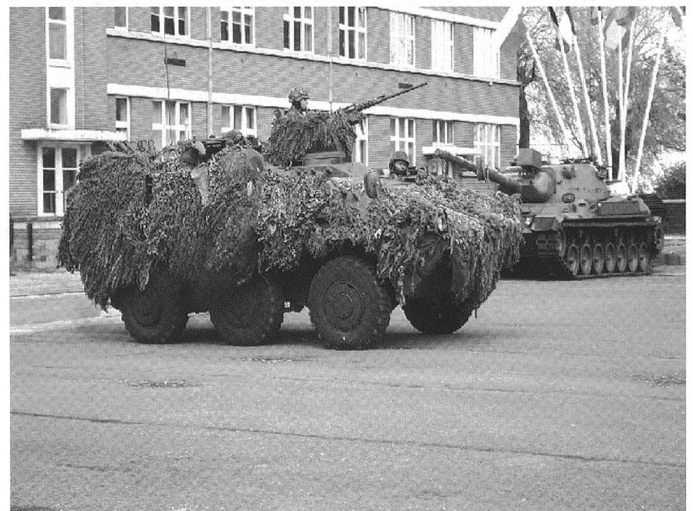
La baisse des budgets et l'augmentation des missions extérieures a encouragé l'achat d'un grand nombre d'engins blindés à roues, ici un Iveco 4x4 et un Steyr 6x6 Pandur.

mines, et enfin la réorientation de la capacité de lutte anti-sous-marine vers une capacité d'escorte maritime multifonctionnelle. Quant aux capacités d'appui stratégique, elles concernent le développement d'une capacité stratégique de renseignement et la consolidation des C 2 I.