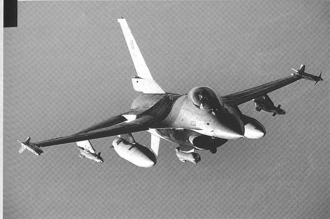
Un F-16 belge en patrouille au-dessus de l'Afghanistan.