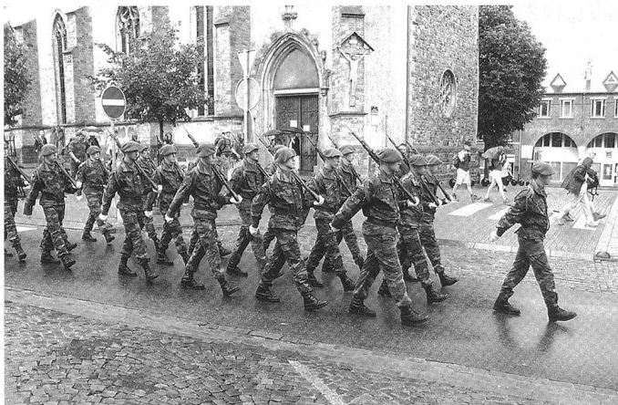
Deux tiers du budget de la défense belge est dépensé en salaires. Le budget et les possibilités d'acquisition et de modernisation sont donc limités. Ici, le régiment des chasseurs ardennais.

du langage « musclé » échangé entre ces deux fortes personnalités politiques, le plan du ministre de Crem peut être considéré au final comme un plan de continuité imposé par les restrictions budgétaires, devant servir de base à un « Plan stratégique révisé » à l'horizon 2030. La structure unique est maintenue tout comme la capacité médiane et les niches capacitaires. Les commandes passées seront honorées à l'exception des AIV de 90 mm, les ventes des gros matériels sont confirmées et accélérées. La participation importante à la NATO Reaction Force (NRF) (2/2008 et 2012) et celle relative aux groupements tactiques interarmées (Battlegroups) de l'UE (2/2009, 1/2012) suivent la ligne. Et malgré les effets d'annonce « musclés, » le plan intègre la sécurité humaine, l'aide humanitaire et l'intégration plus poussée à la PESD/PSDC à travers le souhait de participer à la coopération structurée permanente (CSP) inscrite dans le Traité de Lisbonne mais aujourd'hui non encore activée. Plan de continuité mais aussi inflexions, puisqu'il insiste sur un meilleur partage des risques vis-à-vis des pays alliés en opération extérieure. 9 Prise de risque plus importante pour des raisons de crédibilité et de solidarité. Prise de risque qui implique aussi de mieux protéger les hommes, avec l'accent mis sur le programme de protection individuelle du soldat. L'objectif au final est de pouvoir être dissuasif et pertinent dans les engagements humanitaires comme dans