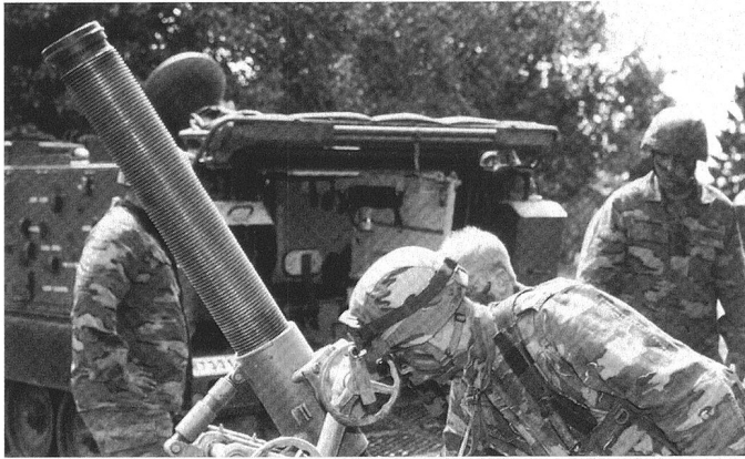
Au contraire, la défense conventionnelle a été en grande partie abandonnée. Pour preuve la quasi absence de moyens d'appui -ici un mortier de 12 cm- qui repose désormais essentiellement sur des pièces de 105 mm tractées.