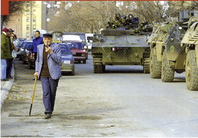
Promotion de la Paix