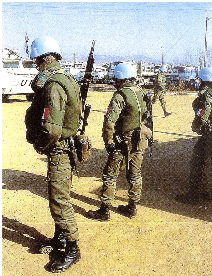
Ci-dessus, casques bleus français à proximité de Sarajevo.