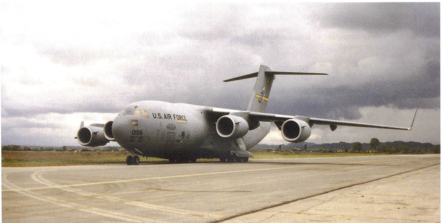
Le pont aérien régulier des Américains (C-17 Globemaster III).