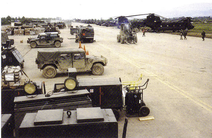
L'encombrement multinational sur le chemin de roulage de Tirana.