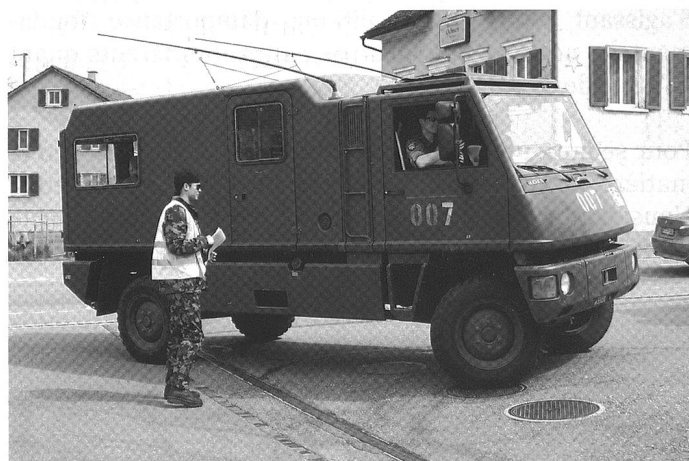
Les postes de commandement mobiles se déplacent au moyen de véhicules légers (en haut, un Duro équipé de matériels de transmissions) ou en véhicules blindés (ci-dessous, un M113, qui équipe encore les échelons de commandement des Grandes unités).