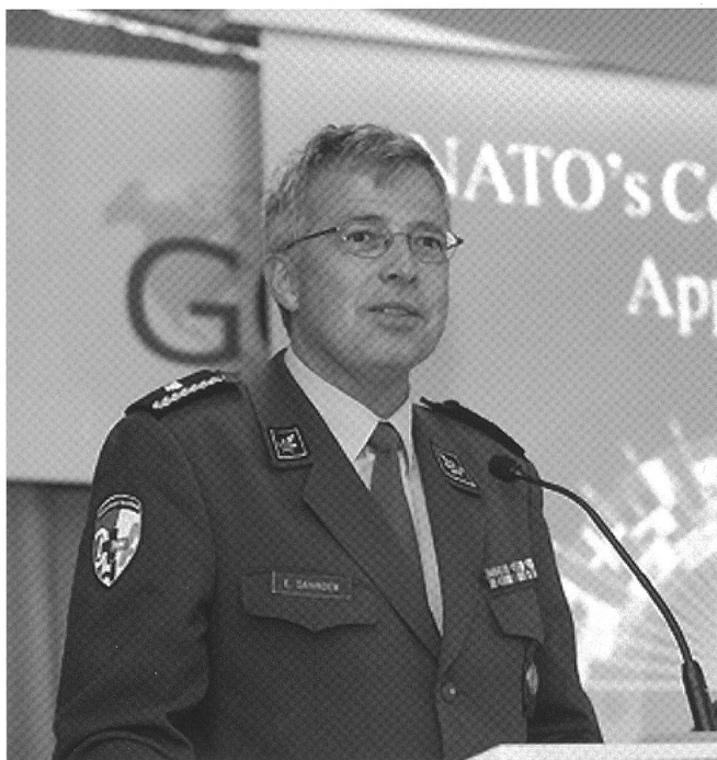
Le brigadier Erwin Dahinden parle au Centre genevois de politique de sécurité (GCSP).